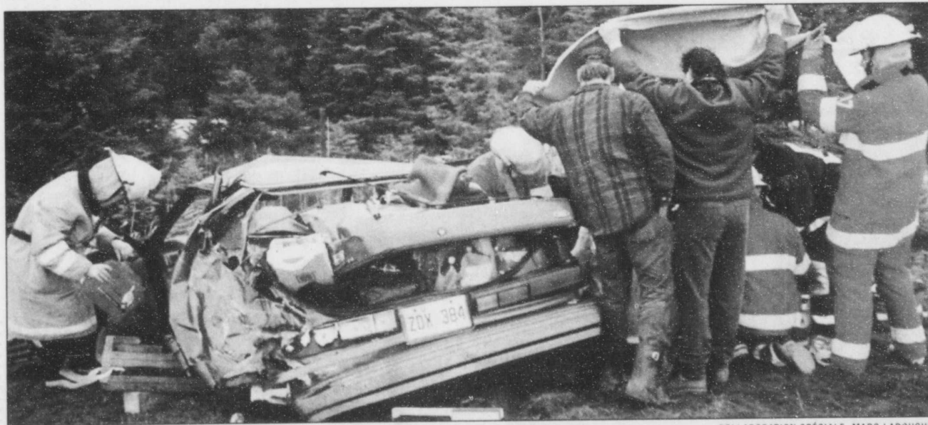
COLLABORATION SPÉCIALE, MARC LAROUCHE

Un couple de Saint-Antonin en a été quitte pour une bonne frousse, hier vers 13h45, sur la route 185, non loin de Rivière-du-Loup. Après avoir arrêté leur voiture sur l'accotement, ils ont repris la route vers le nord, mais n'ont pas remarqué un camion-citerne, appartenant à une compagnie du Nouveau-Brunswick, qui arrivait à toute allure dans la même direction. Le poids lourd a violemment embouti leur automobile et s'est retrouvé dans le fossé. Les deux occupants du véhicule ont été transportés au centre hospitalier de Rivière-du-Loup. Leur vie n'est pas en danger. Quant au conducteur du poids lourd, il s'en est tiré indemne. M.L.