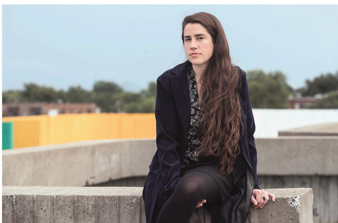
ANNIK MH DE CARUFEL LE DEVOIR

D'une main crue et ferme, mais toujours avec doigté, Stéfanie Clermont explore cet état d'entre-deux qui se prolonge parfois et qui s'accompagne d'un terrible sentiment de défaite: le seuil de la trentaine, le passage terrifiant à l'âge adulte. À la façon de Sabrina (dans L'employée ), qui ne se fait aucune illusion: « Je me sentais déjà vieille, je sentais déjà que j'avais manqué le bateau et que je pourrais sous mes airs de fraîcheur et de santé. » Alors