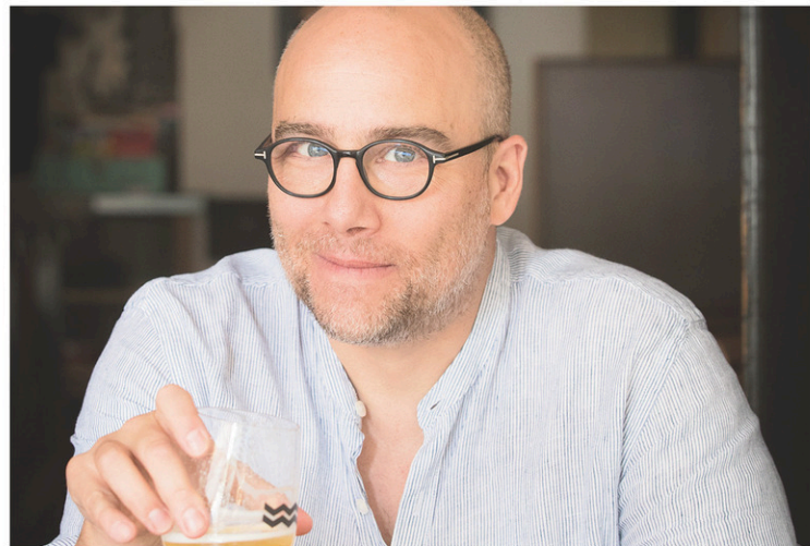
ANNIK MH DE CARUFEL LE DEVOIR

© BTFL, toute reproduction totale ou partielle est interdite.