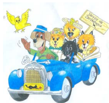
Service de zoothérapie A.P.A.M.

Dans la prochaine chronique nous continuerons de parler de l'accouplement et la reproduction canine. Pour plus de renseignements sur les animaux vous pouvez rejoindre l'association au 819-533-7150 en laissant votre message.