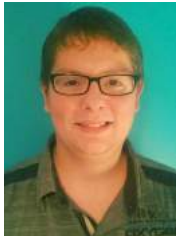
Par Sébastien Lapierre Administrateur à la CDI Saint-Victor