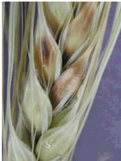
Photo 8. Fusariose de l'épi chez l'orge : la teinte rosée dénote la présence du champignon pathogène.