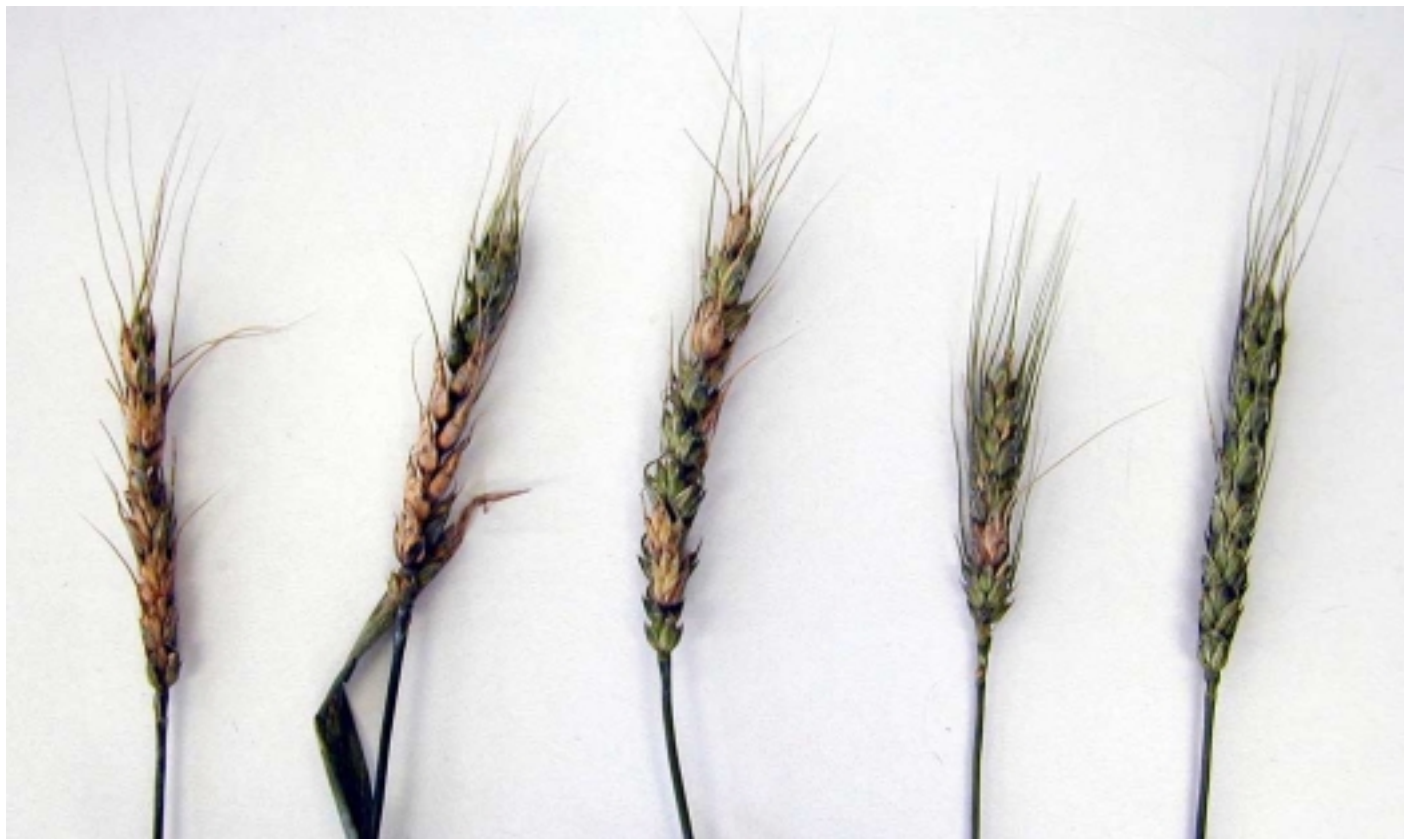
Photo 3. Symptômes de la fusariose de l'épi du blé : épis montrant plus ou moins d'épillets affectés.

Environ 17 espèces de Fusarium ont été associées à la maladie. La plus importante est Fusarium graminearum . Les Fusarium survivent sur les débris végétaux sous forme de spores. Pendant la saison de végétation,