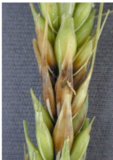
Photo 9. Épi d'orge fusarié. Symptômes peu courants chez l'orge.