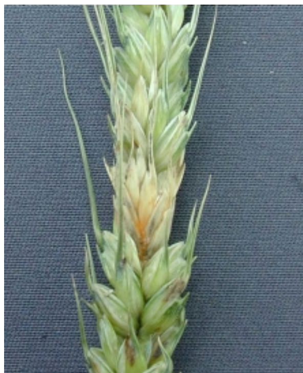
Photo 4. Fusariose de l'épi du blé : la teinte orangée dénote la présence du champignon pathogène.

Étant donné que les Fusarium survivent sur les résidus de culture, on déconseille fortement d'ensemencer du blé ou de l'orge l'année qui suit une culture de céréales (maïs, avoine, blé, orge, seigle, triticale) ou de graminées fourragères (fléole, dactyle, brome, etc.). Le maïs en particulier peut laisser une grande quantité de résidus contaminés à la surface du sol qui constituent un important réservoir d'inoculum, que même un labour ne peut pas éliminer complètement. S'il est absolument