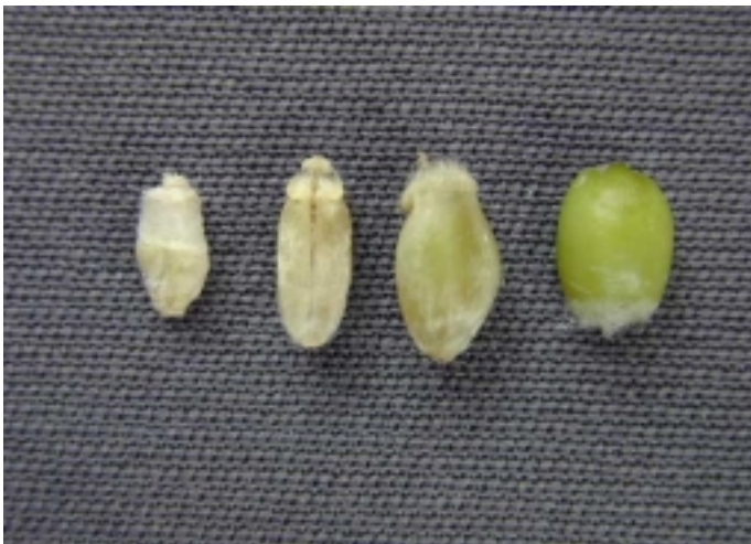
Photo 1. Gros plan de grains du plus au moins fusariés et d'un grain sain.

La fusariose de l'épi n'est pas une maladie récente chez le blé, mais depuis quelques années, son incidence a augmenté considérablement partout en Amérique du Nord. Au Québec, cette maladie constitue un défi constant à la production de blé et de l'orge. La fusariose de l'épi entraîne des pertes de rendement, mais ce sont surtout les toxines produites dans le grain par les champignons pathogènes qui causent le plus de problèmes à toute la filière des grains.