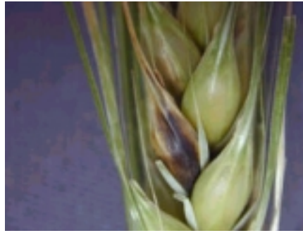
Photo 6. Fusariose de l'épi chez l'orge.