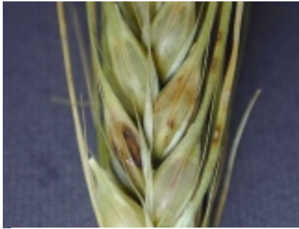
Photo 5. Fusariose de l'épi chez l'orge : les taches brunes dénotent la présence du champignon.