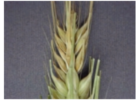
Photo 7. Fusariose de l'épi chez l'orge.