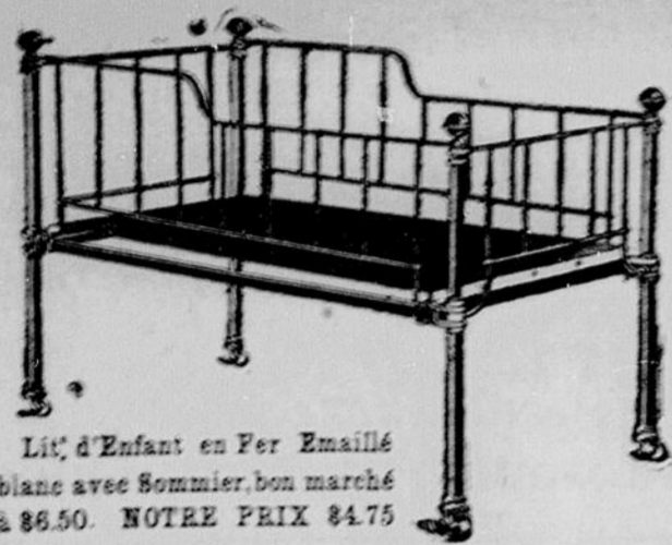
Lit d'Enfant en Fer Emaille blanc avec Sommier bon marché à $6.50. NOTRE PRIX $4.75