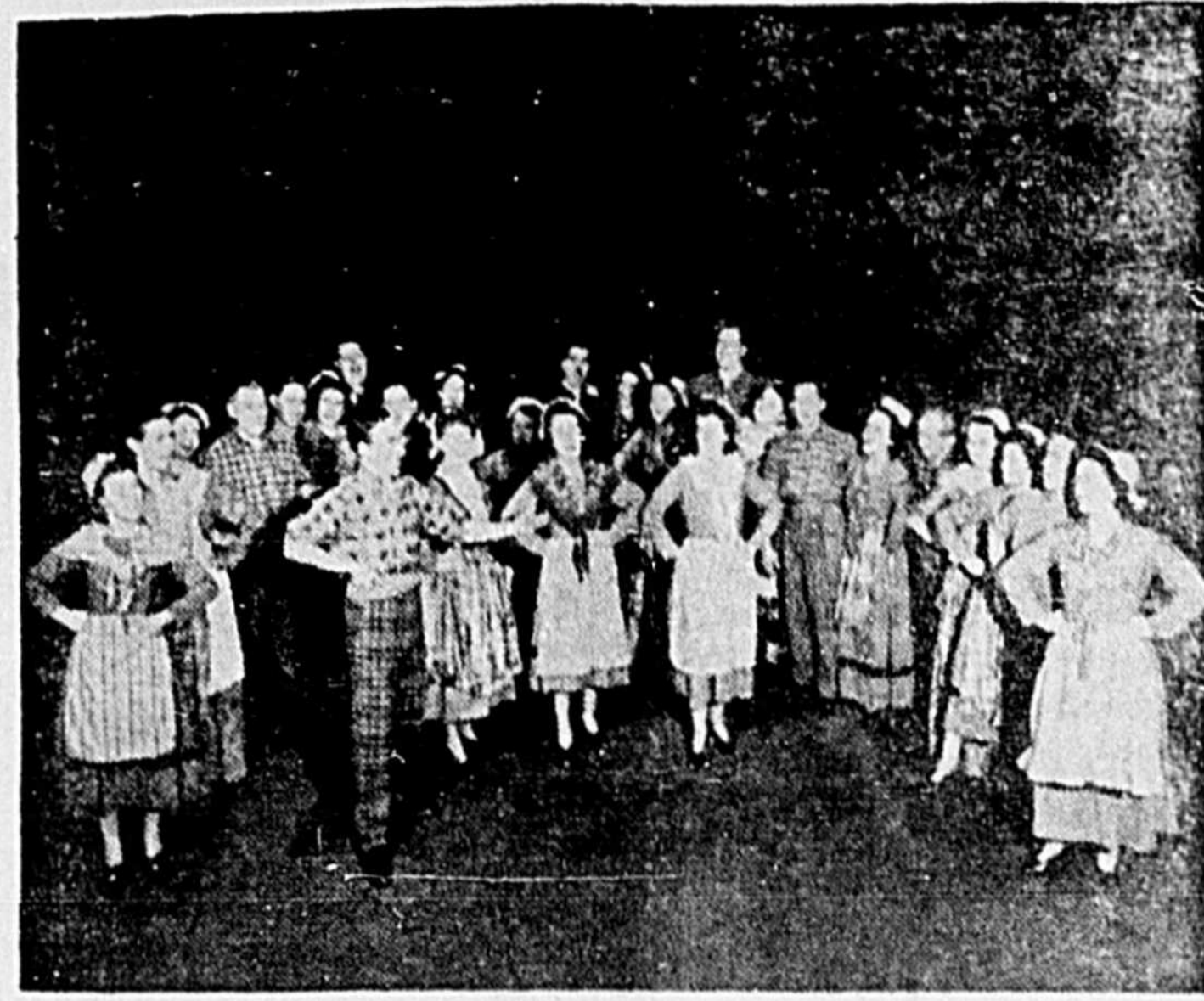
Ci-dessus le chœur Lavallée-Smith, interprétant Papillon, tu es volage. Le fameux chœur donnera un concert à la salle académique du Séminaire de Saint-Hyacinthe, le 16 décembre.