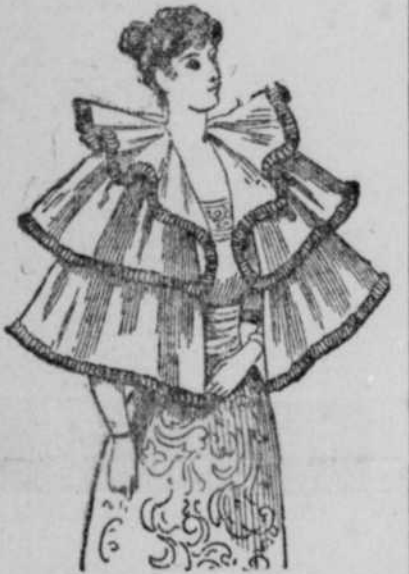
Collet pour jeune femme

Il y a quelques années, dix ou quinze ans, certaines formes d'ajustements et certaines couleurs étaient l'apanage exclusif de la jeunesse. Une femme, passé trente-cinq ans, se portait guère de nuances claires et elle était craint de se couvrir de ridicule en revêtant les coquets attraits de rubans, les fanfreluches juvéniles que l'on voit à chaque pas aujourd'hui dans la rue, sur des personnes de cinquante ans.