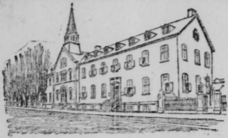
L'INSTITUTION DE NAZARETH, RUE STE CATHERINE