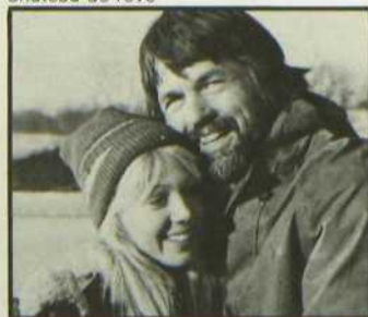
Château de rêve

Le réalisateur a su ne pas tomber dans le sentimentalisme mélodramatique et il fait preuve d'une grande dextérité dans les scènes sportives.