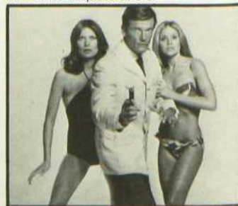
L'Homme au pistolet d'or

L'agent 007 finira par débusquer Scaramanga dans une petite île déserte près de la côte chinoise, et il le trouve détenteur d'une arme à énergie solaire fort dangereuse pour l'humanité... Un duel à mort s'engage entre les deux hommes.