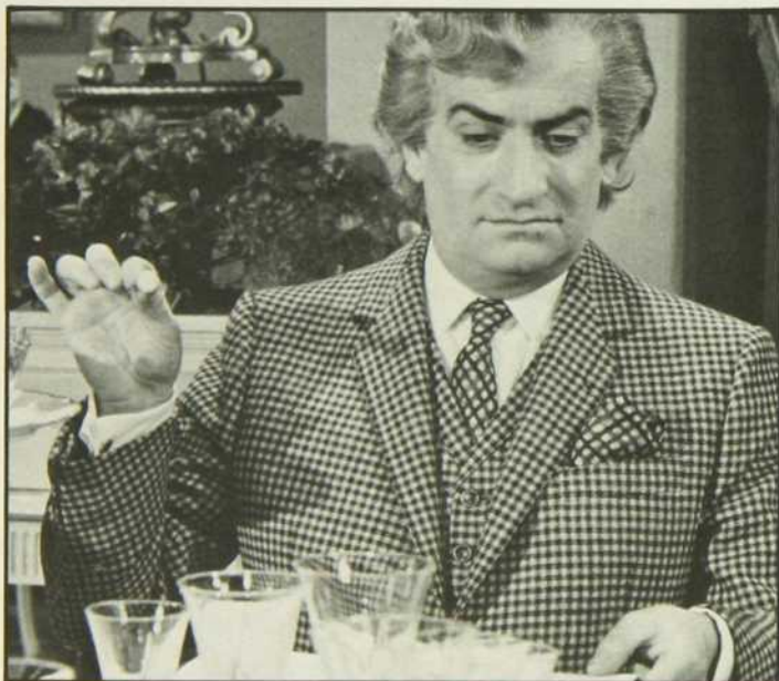
Le Grand Restaurant

Un épisode des Grands Esprits sera également enregistré au Salon du livre. Au cours de cette émission, Edgar Fruitier aura pour invités Niccolò Machiavelli, Sun Yat Sen, George Sand et Aristote.