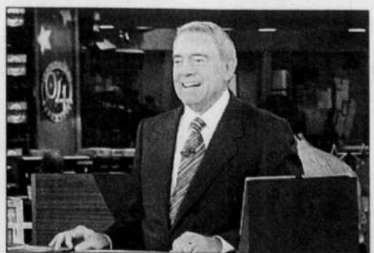
Dan Rather, chef d'antenne de CBS, quittera ses fonctions cet hiver.