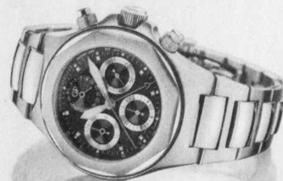
CHRONOMETRE AUTOMATIQUE MOVEMENT GP 03300 CALENDRIER COGNITION VISIBILE