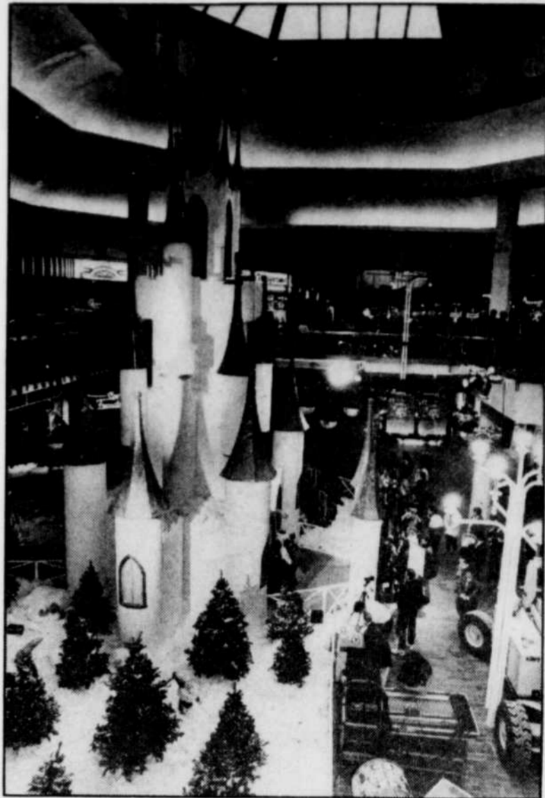
Le château du Père Noël aux Galerias de la Capitale.

Jusqu'au 13 décembre, les Galerias de la Capitale invitent les enfants à rencontrer le Père Noël quotidiennement à Télé 4, à compter de 16 h du lundi au vendredi, ainsi qu'à 11 h 40 le samedi et 16 h 25 le dimanche. Évidemment, les enfants peuvent rencontrer un Père Noël bien en chair sur place au mail central des Galerias. Pour la période des fêtes, celles-ci seront ouvertes tous les soirs, de même