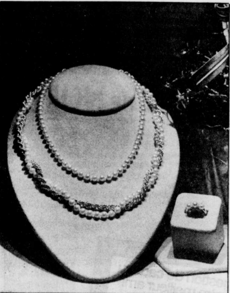
Le collier de perles demeure un présent classique et de bon goût à l'occasion de Noël.