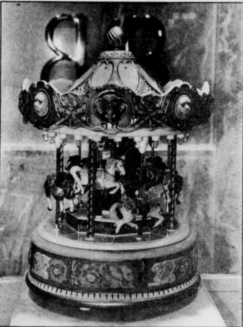
Ce carousel électrique, avec magnocassette intégré qui permet de faire jouer la musique de son choix, sera à vous pour la modique somme de 2 000 $.