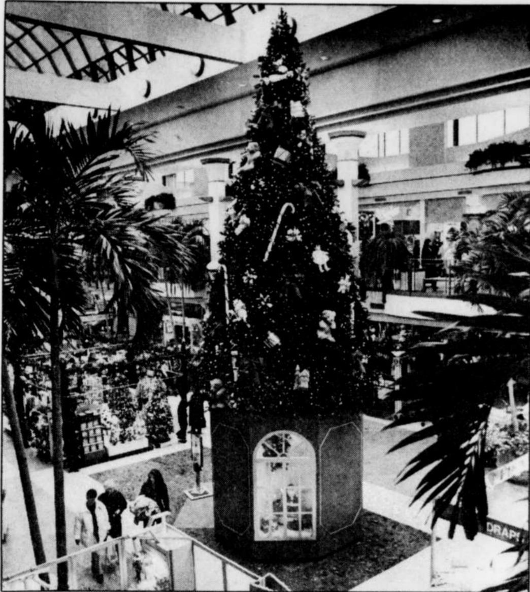
L'Arbre enchanté de Place Laurier.

À ne pas manquer, entre autres, la chorale St-Louis de Gonzague et le groupe vocal Vibrations, le dimanche 6 décembre; les musiciens ambulants du groupe Strada, les 12 et 13 décembre; ainsi que le Quatuor des Maîtres-Chanteurs, les 19 et 20 décembre.