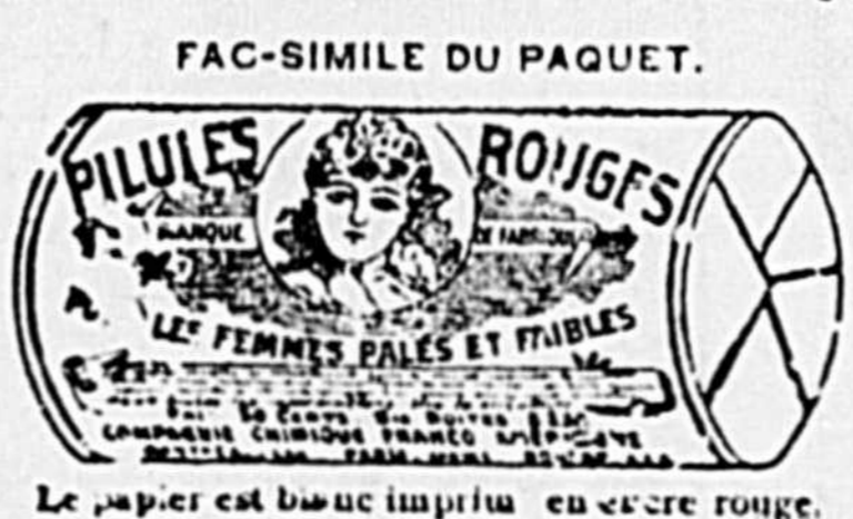
Le papier est blanc imprimé en encre rouge.

AVIS A NOS PATIENTES. Nous attirons votre attention sur le fait très important de tous nos remèdes. Nos PILULES ROUGES, tant que nous avons retranché le nom du Dr. Coderre PILULES ROUGES de la CIE CHIMIQUE FRANCO-AMERICAINE. Pour le plus grand intérêt de nos patientes, nous avons cru faire ce changement, elles devront donc comme par le passé, exiger que le nom de la CIE CHIMIQUE FRANCO-AMERICAINE, soit sur chaque boîte, c'est le seul moyen d'avoir les véritables PILULES ROUGES et de se guérir rapidement. Elles devront refuser comme imitation, toutes PILULES ROUGES vendues de porte en porte et aussi celles vendues au 100 ou à 25c. la boîte.