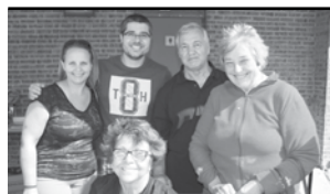
Équipe du journal