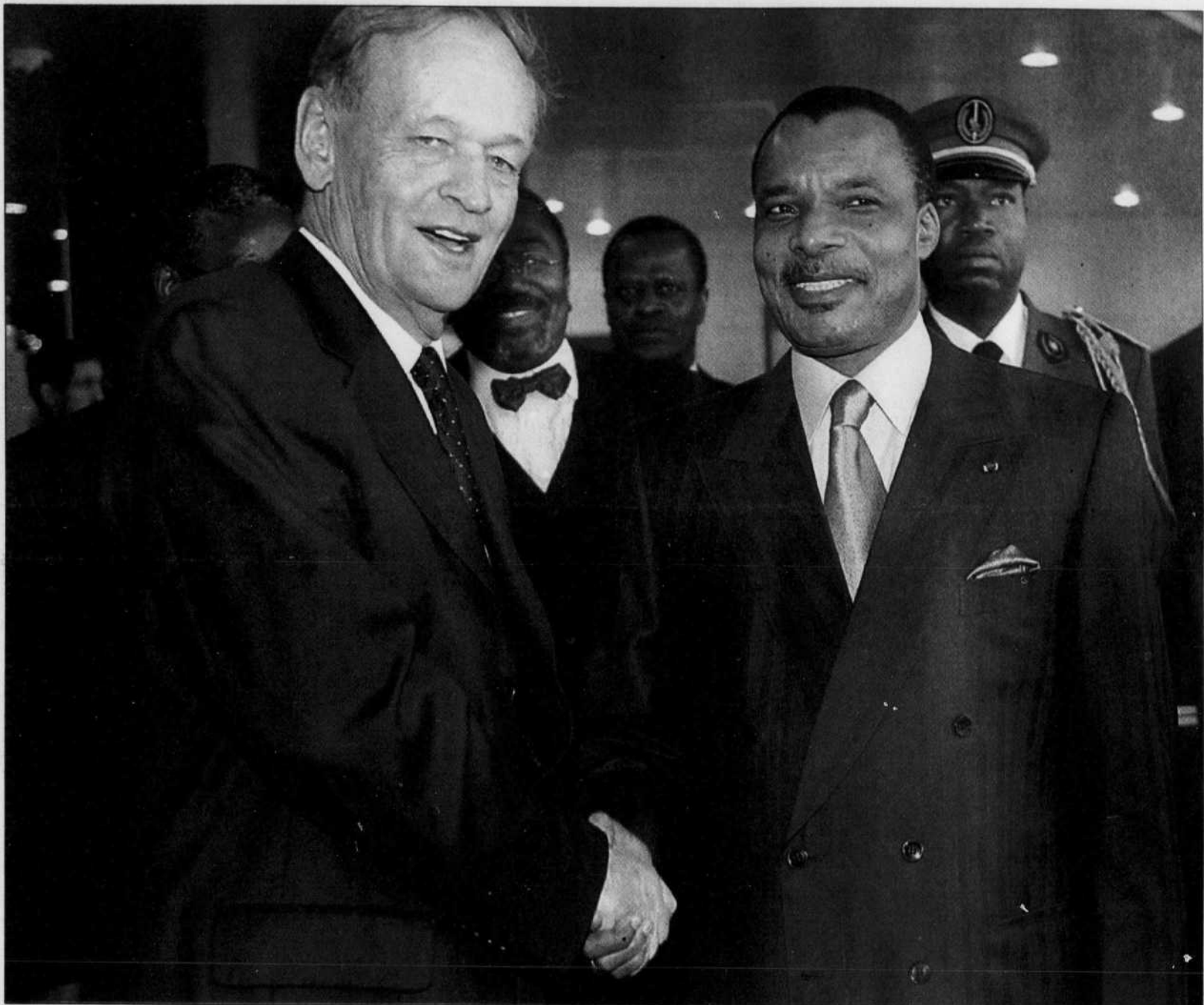
Le premier ministre canadien Jean Chrétien a serré la main au président du Congo-Brazzaville, Denis Sassou-Nguesso, hier à New York, lors d'une journée consacrée à l'Afrique. M. Chrétien a de nouveau mis en garde les pays riches contre l'élargissement du fossé qui les sépare des pays pauvres.