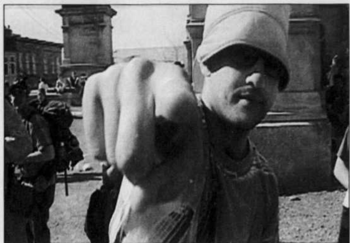
Les Loco Locass dans le film Musiques Rebelles Québec .

Quoi qu'il arrive, que CM intègre ou non tous les professionnels, plusieurs dossiers chauds vont occuper l'organisme au cours des prochains mois, notamment la définition d'une politique de la culture pour Montréal.