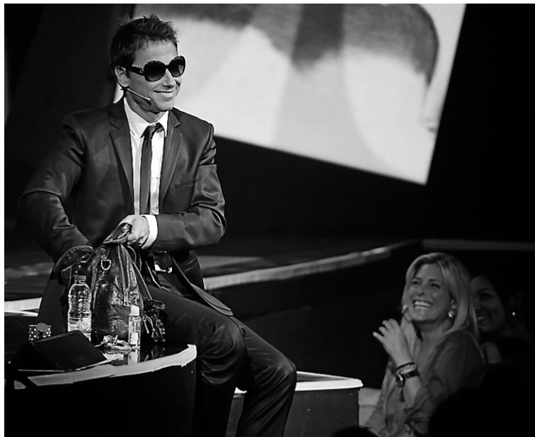
Stéphane Rousseau a fouillé dans le sac à main d'une spectatrice pour apprendre à mieux la connaître.

Premier invité de la soirée, Kheiron, qu'on a pu découvrir dans l'excellente webtélé française Bref , décoiffe avec un numéro dans lequel il parle de sa copine qui lui annonce qu'elle est enceinte. «J'ai fait une crise d'angoisse, mais rassurez-vous, tout va bien: elle a perdu le bébé», lance-t-il au