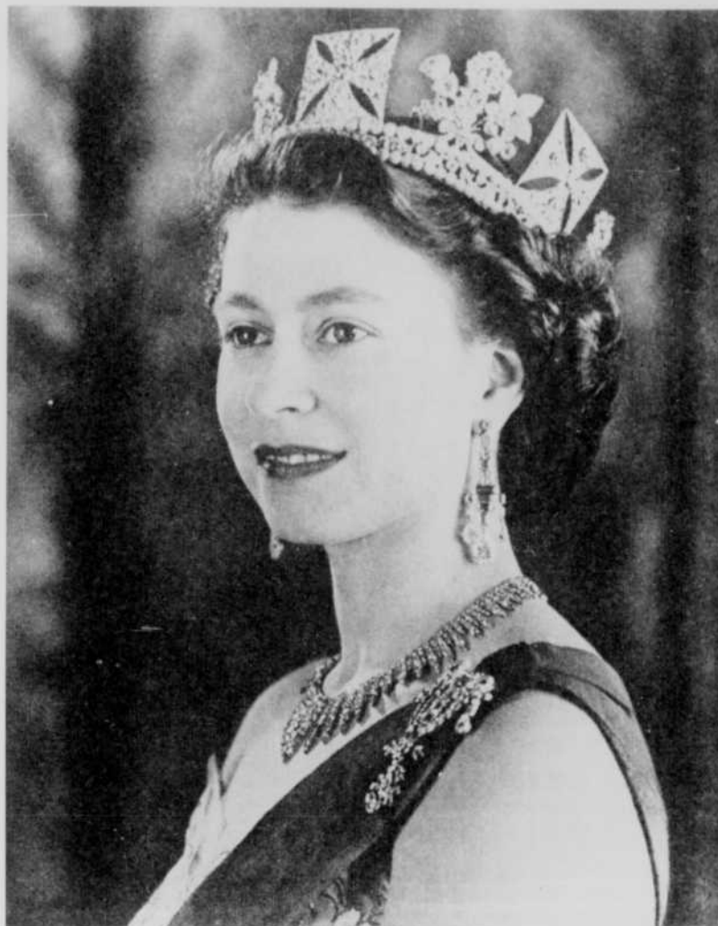
SA MAJESTÉ ELIZABETH II

Après cette cérémonie, les caméras accompagneront le cortège royal qui suivra le même itinéraire pour retourner à Rideau-Hall.