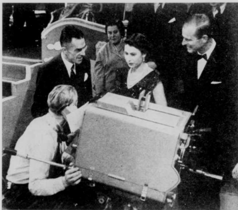
A l'occasion de la visite royale, la télévision canadienne déploiera toutes ses ressources techniques. Sur cette photo, prise dans les studios de la BBC à Lime Grove, on voit la reine Elizabeth, accompagnée du duc d'Edimbourg, questionner un cameraman sur son travail. Depuis son couronnement, où elle fut sous le feu des caméras pendant des heures de suite, la reine a souvent paru à la télévision, un art auquel elle s'intéresse beaucoup.

Lorsque nos souverains se rendront aux États-Unis, ces réseaux rendront le même service à Radio-Canada.