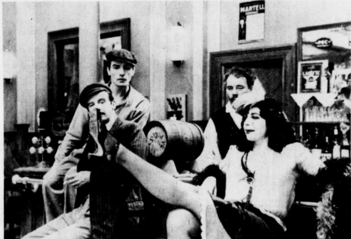
Le Bal, un film de Ettore Scola

Peter Gross, quant à lui, transforme en monuments les manèges d'un parc d'attractions. Lignes, couleurs, équilibre des formes, tension des structures, tout est extrait de son cadre naturel. Peter Gross dans ses photos marque clairement les limites de son espace; le ciel n'est pas d'un azur pur mais bien plus une suite de démarcations; son objectif définit les paramètres de sa vision. Avec la sûreté du cartographe, il joue avec la profondeur et les angles. Les structures d'acier des manèges tracent dans le ciel, les lignes d'un univers à deux dimensions.