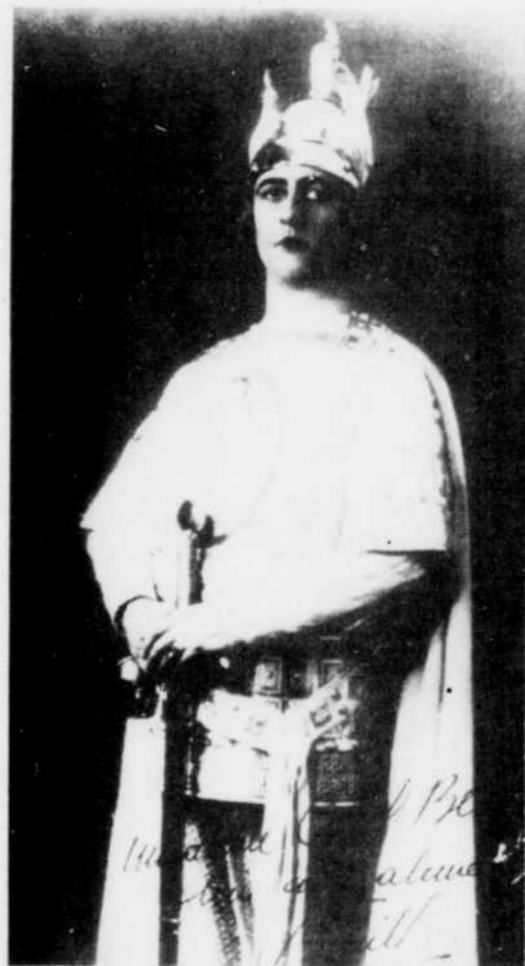
Georges Thill aux heures de sa gloire comme ténor.

Conscient de ses faiblesses, il partit de 1921 à 1923 se perfectionner à Naples chez le ténor Fernando de Lucia (1860-1925) qui lui apprit à raison d'une à deux leçons par jour