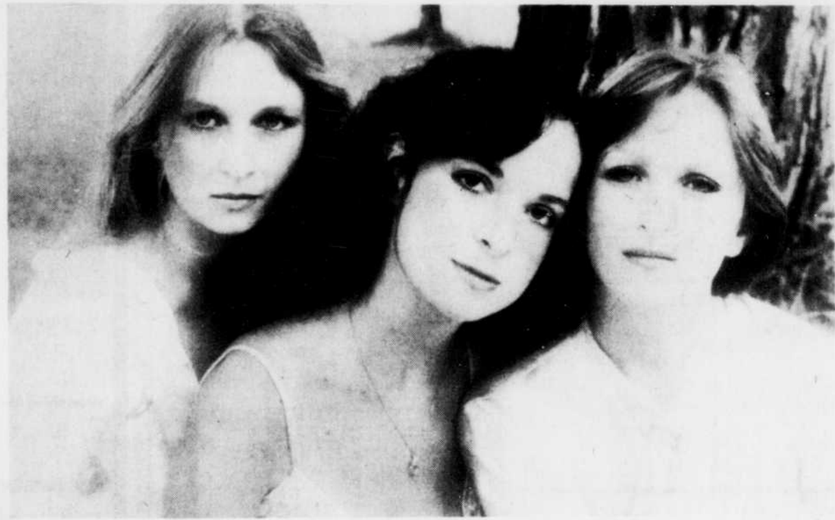
Le trio Bowkun

Une salle de bal, différentes époques: "La grande histoire lue à travers la petite: celle des