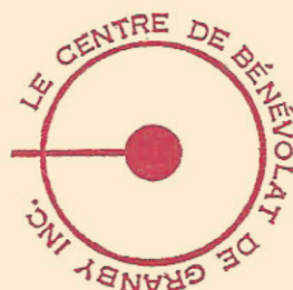
Logo de 1966 à 1985

La survie du Centre est menacée, faute de financement. On lance un s.o.s. à la Fédération des services communautaires Richelieu-Yamaska.