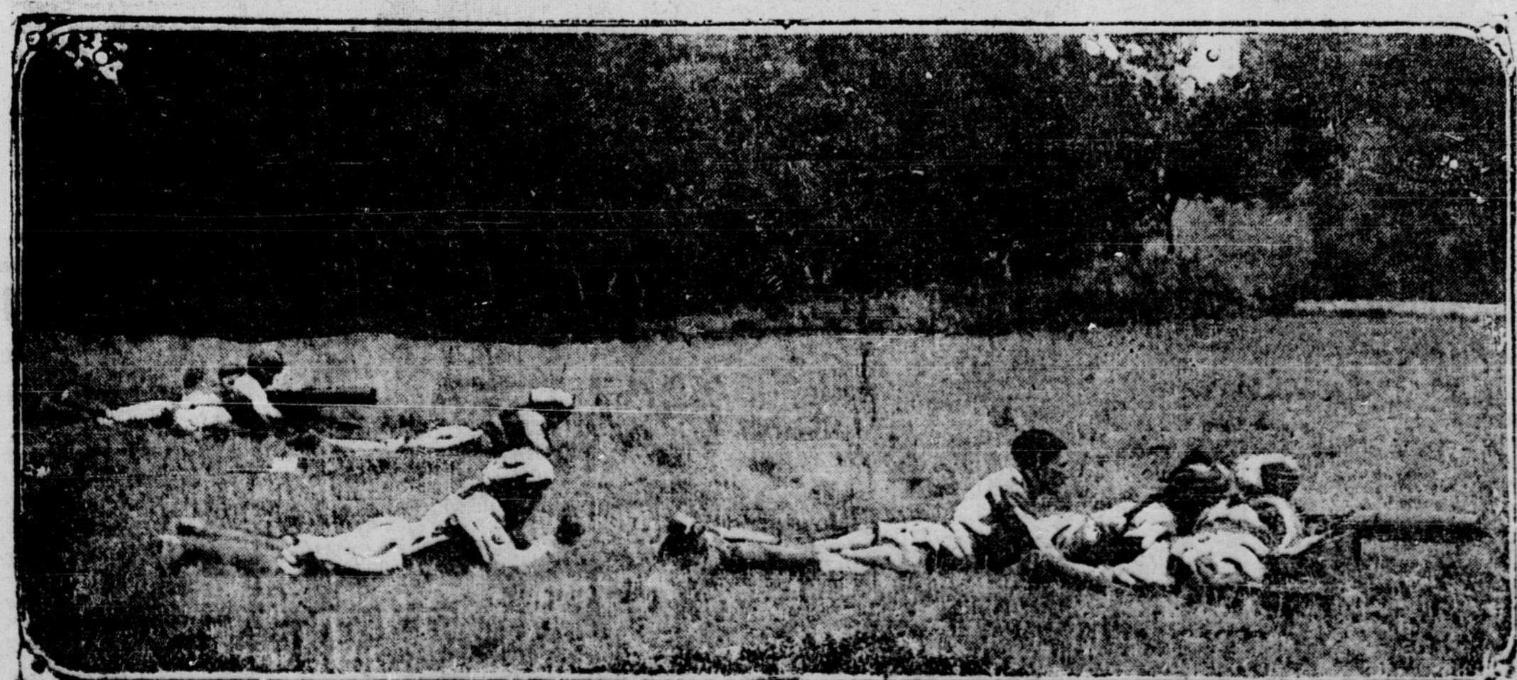
SALDOTS HINDOUS, se servant de mitrailleuses Maxim. Ils sont accompagnés de soldats anglais qui achèvent leur instruction sous ce rapport et leur montrent comment se servir de ces joujoux dangereux. Ces soldats de l'Inde sont très intelligents et d'une très grande bravoure.