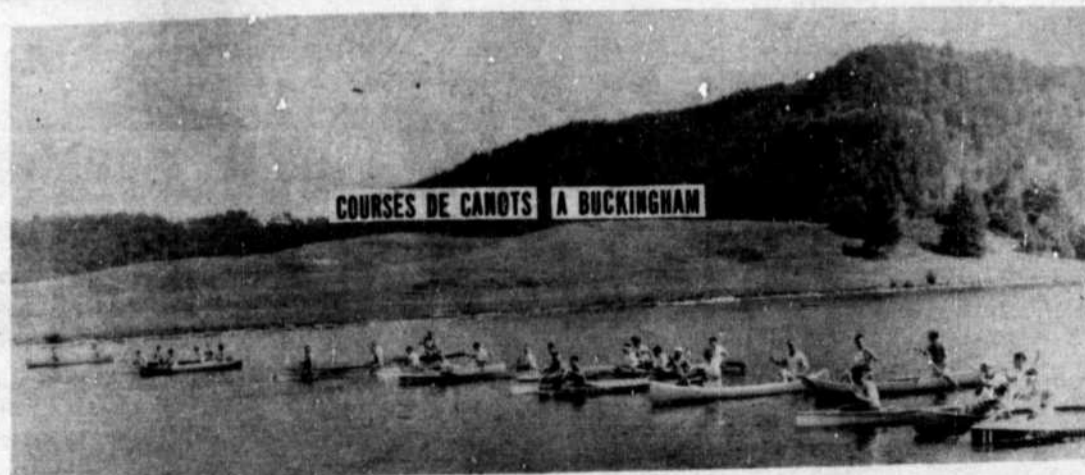
COURSES DE CANOTS A BUCKINGHAM