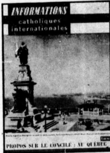
PROPOS SUR LE CONCILE: AU QUEBEC

Joignez-vous dès maintenant aux lecteurs de plus en plus nombreux des "Informations Catholiques Internationales" qui se reconnaissent comme privilégiés d'avoir ainsi à leur disposition une revue de qualité qui les aide non seulement à "regarder" mais à "vivre" le Concile.