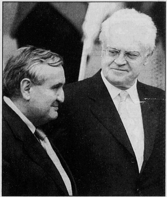
Lionel Jospin a salué Jean-Pierre Raffarin lors de leur passage à Matignon.

Lors de ses passages au Québec, M. Raffarin s'est rendu non seulement dans la capitale et dans la métropole, mais il a visité plusieurs régions du Québec et a séjourné notamment à Sherbrooke.