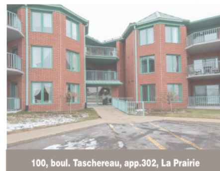
100, boul. Taschereau, app.302, La Prairie

BELLE occasion RARE! AUCUN VOISIN ARRIÈRE! Vous êtes à 2 pas des : parc national, pistes cyclables en montagne, verger, pistes de ski de fond et alpin... Parfait pour les amants de la nature. L'été, faites votre marché à la ferme à pied. Près des grands axes routiers 116, 20 et 30... OCCASION DE VIVRE « ZENNEMENT » à L'ANNÉE! 799 900 $. Centris 15472777