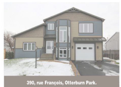
390, rue François, Otterburn Park.

Coup de coeur! Venez visiter cette unité de coin à l'étage supérieur (3e). Condo lumineux et ensoleillé grâce à sa grande fenestration. Belle cuisine fonctionnelle, salle à manger donnant sur le balcon, salon avec magnifique foyer deux faces, plafond de près de 10 pieds. Ascenseur, piscine, sauna et gym, garage double intérieur avec grand rangement. 289 000 $. Centris 24726402