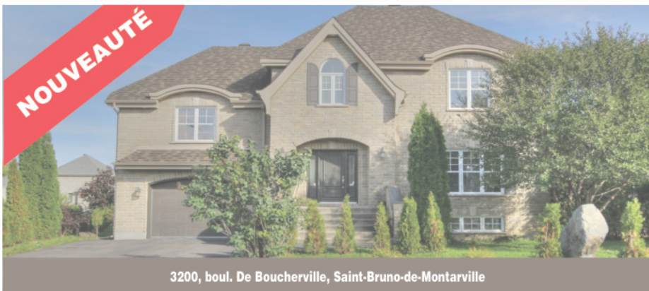
3200, boul. De Boucherville, Saint-Bruno-de-Montarville

Somptueuse propriété avec garage, sise dans un quartier à envier! Distinction et confort sont au rendez-vous dans cette magnifique maison de cinq chambres à coucher et trois salles de bain! Présence accrue de lumière naturelle dans toutes les pièces, matériaux de qualité, et plus encore! Grand terrain (coin de rue) paysager. À voir absolument! 599 000 $. Centris 27200457