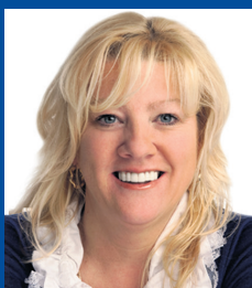
Champagne Andrée, ctr. imm.