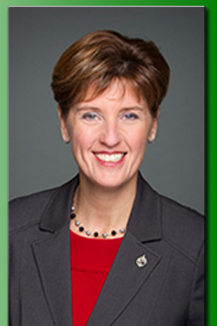
L'Honorable Marie-Claude Bibeau Ministre du Développement international