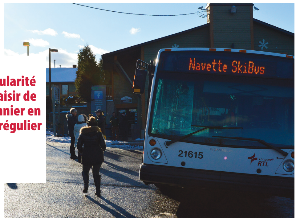
SkiBus fait maintenant partie de l'offre régulière du RTL.

Les départs se feront à partir du métro Longueuil – Université-de-Sherbrooke à destination de Ski Saint-Bruno, avec un dernier départ de la station de ski à 22 h. Durant la semaine de relâche en mars, le RTL bonifie généralement l'offre en augmentant le nombre de départs.