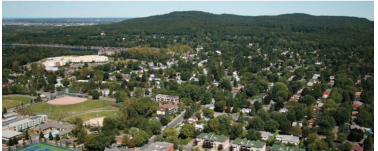
La saison estivale 2018 a été encore meilleure que celle de 2017.

Un peu plus du quart des répondants ont également remarqué une augmentation des dépenses de leur clientèle