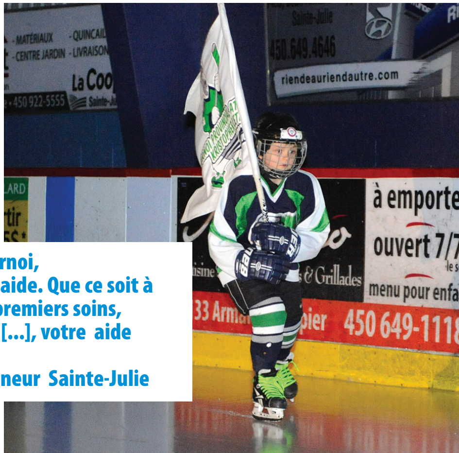
Le Tournoi provincial de hockey atome Kristopher-Letang est à la recherche de bénévoles.

Bien que 60 équipes soient actuellement inscrites à la compétition, c'est plutôt la présence des bénévoles qui tracasse les membres du comité organisateur.