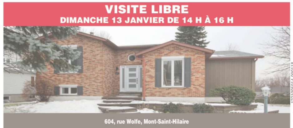
VISITE LIBRE DIMANCHE 13 JANVIER DE 14 H À 16 H

Somptueuse propriété avec garage, sise dans un quartier à envier! Distinction et confort sont au rendez-vous dans cette magnifique maison de cinq chambres à coucher et trois salles de bain! Présence accrue de lumière naturelle dans toutes les pièces, matériaux de qualité, et plus encore! Grand terrain (coin de rue) paysager. À voir absolument! 599 000 $. Centris 27200457