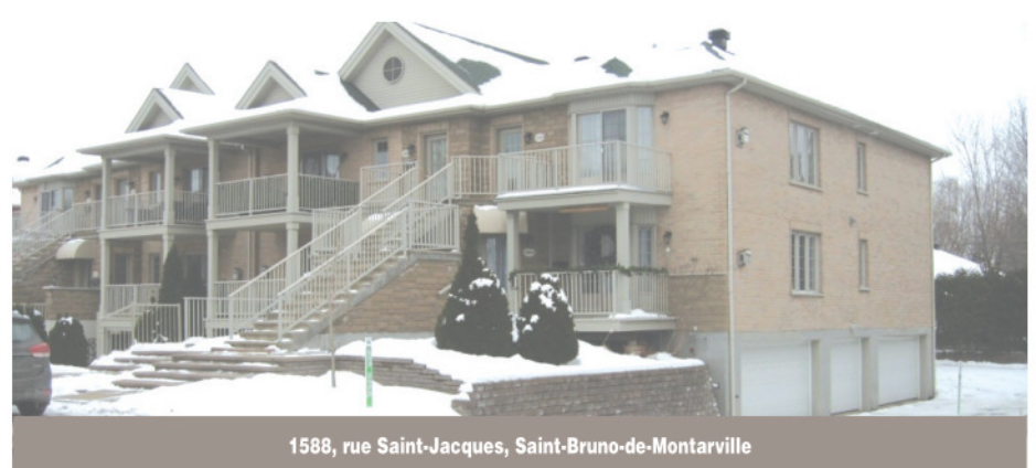
1588, rue Saint-Jacques, Saint-Bruno-de-Montarville

Beau duplex avec un logement rénové de trois pièces au sous-sol. Proche des écoles et parc, les deux logements principaux ont trois chambres, plancher de lattes au rez-de-chaussée et à l'étage, grand garage pour logement du rez-de-chaussée et belle salle familiale. Duplex entretenu au fil des années. Grande chambre froide en dessous de la galerie. 519 000 $. Centris 26357168