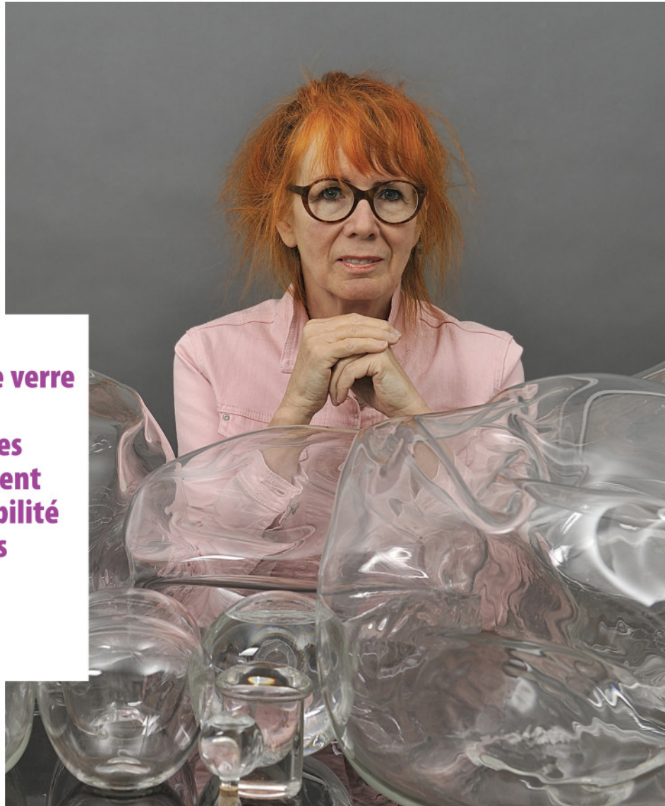
Mettre la tête où on pense était en exposition au Vieux Presbytère jusqu'au 2 décembre.

L'œuvre récompensée était présentée au Centre d'exposition du Vieux Presbytère de Saint-Bruno du 21 octobre au 2 décembre.