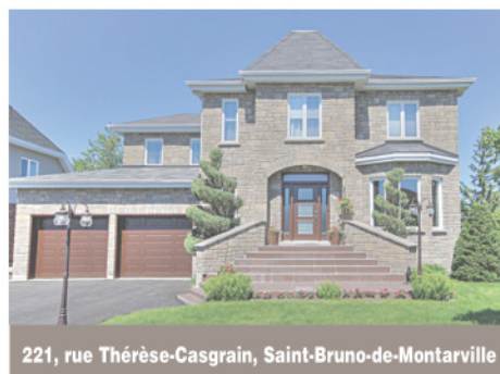
221, rue Thérèse-Casgrain, Saint-Bruno-de-Montarville

BELLE occasion RARE! AUCUN VOISIN ARRIÈRE! Vous êtes à 2 pas des : parc national, pistes cyclables en montagne, verger, pistes de ski de fond et alpin... Parfait pour les amants de la nature. L'été, faites votre marché à la ferme à pied. Près des grands axes routiers 116, 20 et 30... OCCASION DE VIVRE « ZENNEMENT » à L'ANNÉE! 799 900 $. Centris 15472777