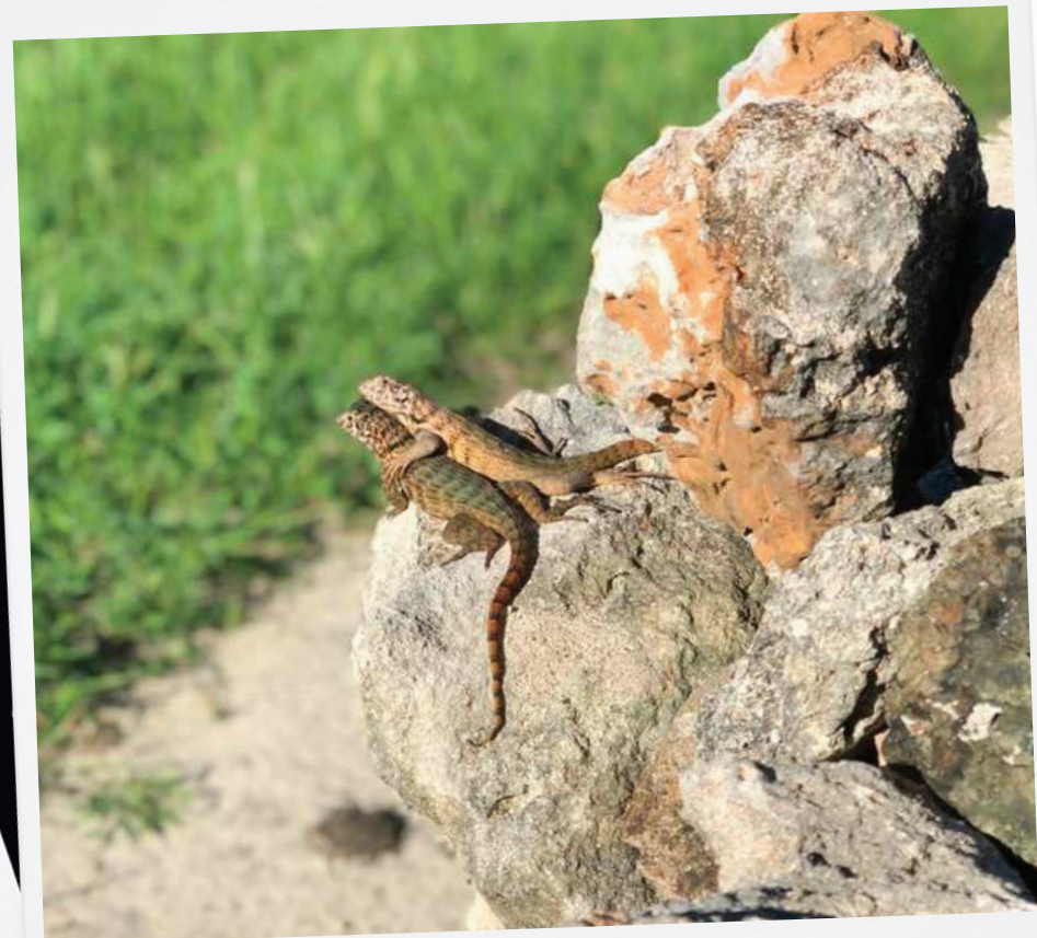
Deux lézards bras dessus bras dessous surpris à Cuba par une photographe montarvilleuse.

(Les photos publiées peuvent être réutilisées pour illustrer des articles de nos publications.)