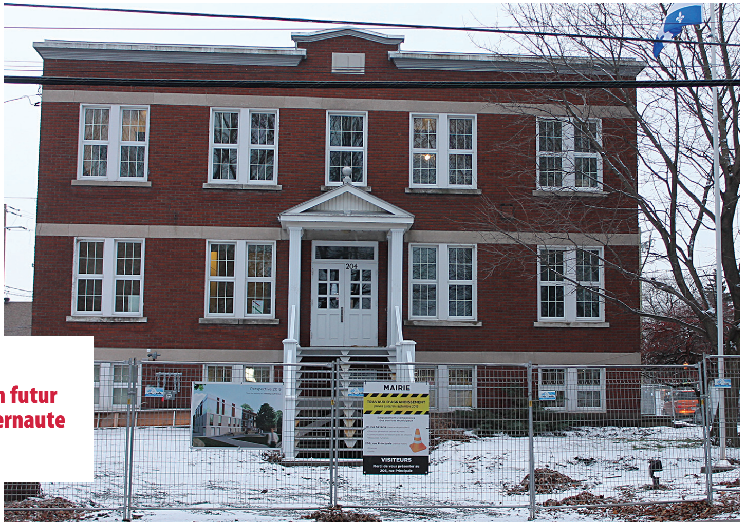
L'agrandissement de la mairie de Saint-Basile-le-Grand, entre autres, a été l'un des sujets sur lesquels les internautes n'ont pas hésité à déverser leur fiel.