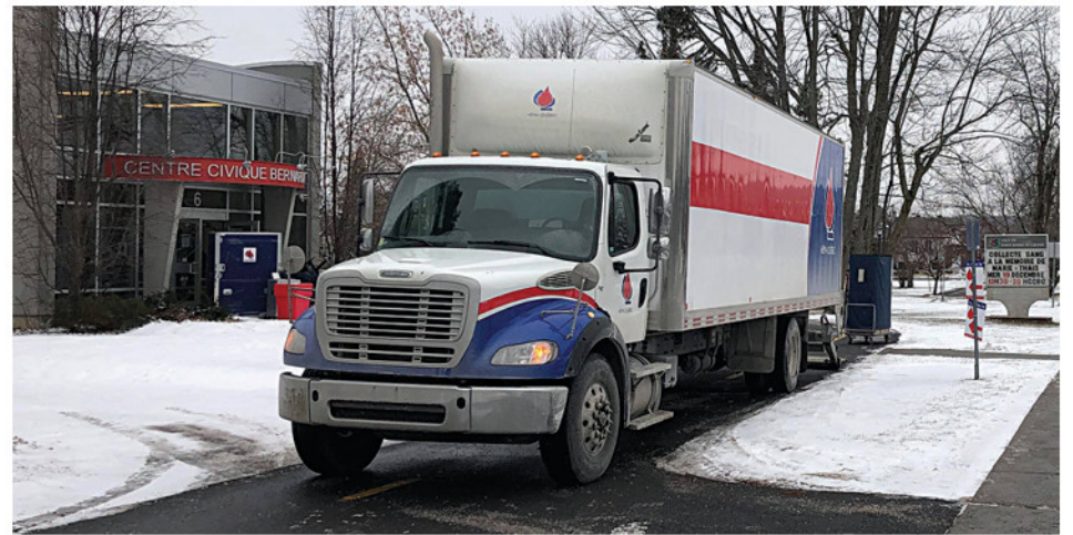
Plus de 160 personnes ont participé à cette collecte, organisée en mémoire de Marie-Thaïs.

Comme chaque année, ceux-ci souhaitent interpeller plus de donateurs que le nombre de transfusions qu'a reçues la fillette, soit 123. C'est donc dire que cette année, l'objectif a non seulement été atteint, mais il a été largement dépassé! D'ailleurs, il s'agit d'une participation record du public pour cette clinique de sang, si on compare avec les années précédentes. Depuis 2013, l'activité a reçu respectivement 132 donateurs (2013), 118, 151, 135, 132 et 165