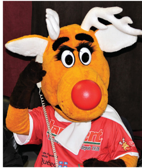
La mascotte d'Opération Nez rouge a mis la main à la pâte.

En comparaison, au Québec, la 35 e Opération Nez rouge a mobilisé 39 674 bénévoles qui ont bravé les aléas de dame Nature pour ramener en sécurité 55 720 clients à la maison. Il faut rappeler que le porte-parole de cette campa-