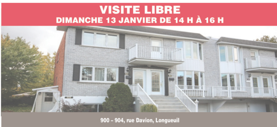
VISITE LIBRE DIMANCHE 13 JANVIER DE 14 H À 16 H

Magnifique! Rénovée en 2018, vous resterez bouche bée dès votre entrée! Cette maison à aire ouverte moderne est pourvue d'un plancher de bois et d'un plafond cathédrale. Luminosité exceptionnelle au rez-de-chaussée comme au rez-de-jardin. Total de quatre cac. Terrain de plus de 12 400 pi2 situé dans un secteur recherché. Une visite et vous serez conquis. 449 000 $. Centris 20889717