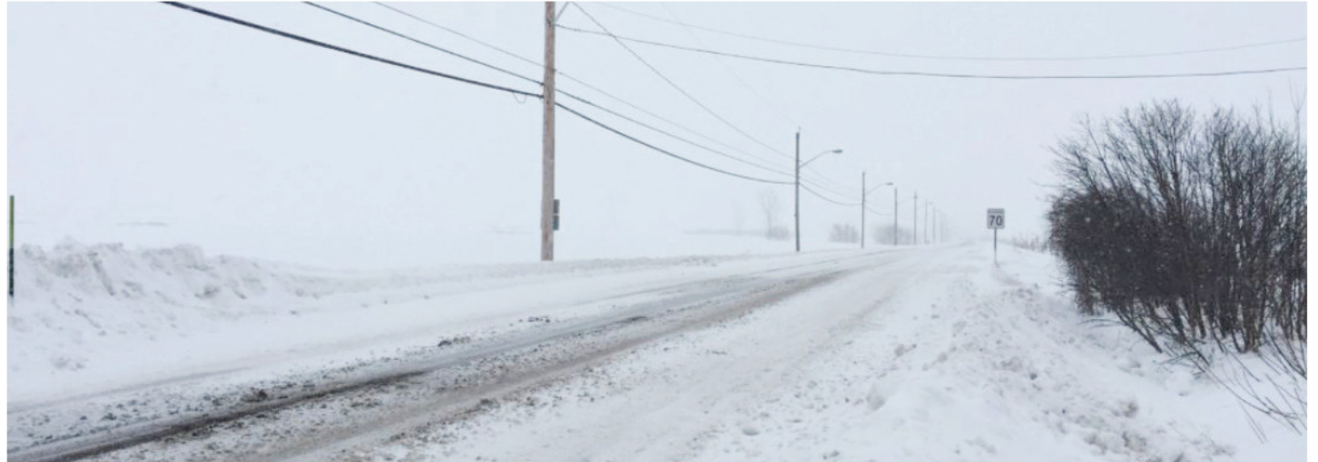
La destination la plus populaire demeure Cuba.

Rappelons qu'un froid glacial a marqué les derniers jours de novembre 2018; donc, le vice-président des services voyages de CAA-