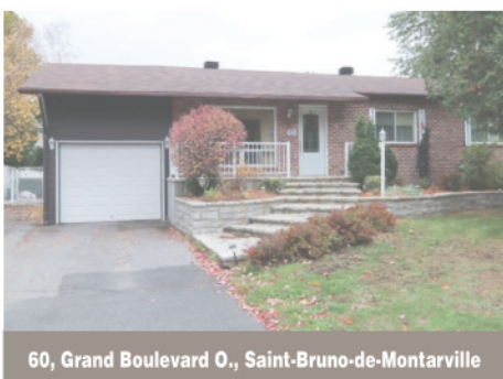
60, Grand Boulevard O., Saint-Bruno-de-Montarville

Unité de coin, condo très lumineux, cuisine, salle de bain rénovée au goût du jour, foyer au gaz dans le salon. En plein coeur du village, tout peut se faire à pied, ensoleillé. 284 500 $. Centris 12615627