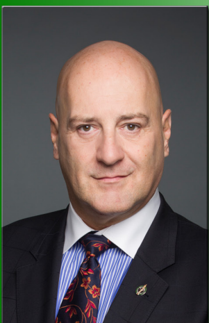
Michel Picard Député fédéral de Montarville