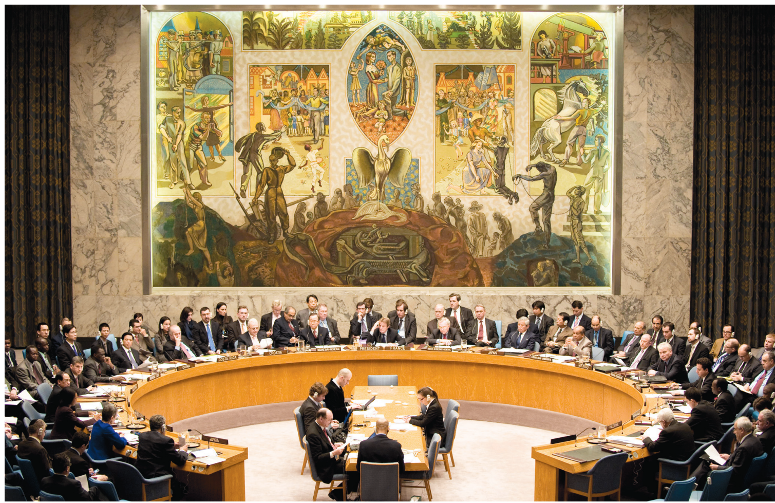
Les membres du Conseil de sécurité en réunion le 6 janvier dernier

À ce moment, on a commencé à comprendre l'échec du Canada, qui a pris le troisième rang du premier tour (114 votes), derrière le Portugal (122 voix). La veille, le lundi soir, lors d'une entrevue avec