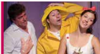
Les petits orteils 3 à 10 ans 24 novembre - 11 h Théâtre