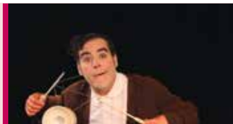
Clip 4 à 9 ans 20 octobre - 11 h Spectacle clownesque