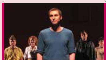
Moi, dans les ruines rouges du siècle 6 octobre - 20 h TLG