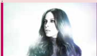
Marie-Mai 28 et 29 septembre - 20 h TLG