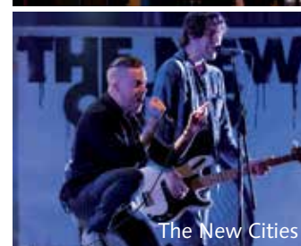
The New Cities