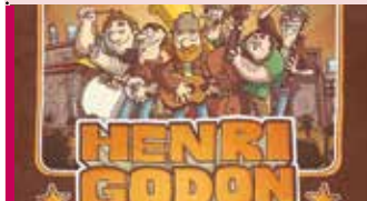
Henri Godon: chansons pour toutes sortes d'enfants 5 à 12 ans 26 janvier - 11 h Chanson