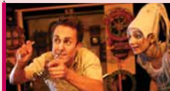
Dada 5 à 12 ans 23 février - 11 h Théâtre clownesque