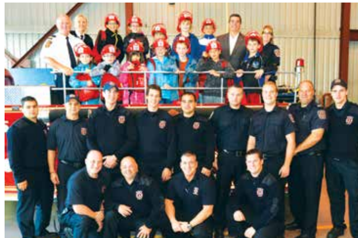
Les gagnants de l'édition 2012 du Concours pompier d'un jour posent en compagnie de membres du Service de la Sécurité incendie.

Pour plus d'informations, visitez le site microsite Internet plandevacuation.ca et consultez notre page Facebook!