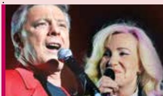
Herbert Léonard et Michèle Torr 3 octobre - 20 h TLG