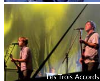
Les Trois Accords