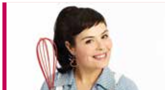
Ari Cui Cui 1 à 9 ans 29 septembre - 11 h Chanson

De grands spectacles offerts à petits prix les dimanches!