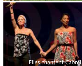
Elles chantent Cabrel