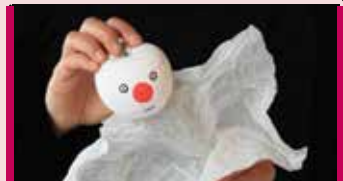
Pomme 3 à 6 ans 27 avril - 11 h Marionnettes

Prix courant: 10 $ Prix abonné: 8 $ (quatre spectacles et plus) Achat de billets: 450 434-4006 ou www.odyscene.com ■