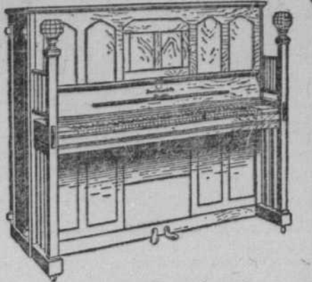
Un Piano Automatique Heintzman & Co. Valeur de $825.