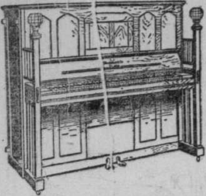
Un Piano Automatique Heintzman & Co. Valeur de $825.