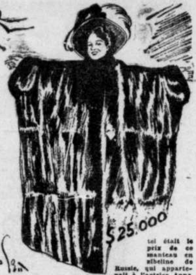
tel était le prix de ce manteau en sabeline de Russie, qui appartenait à l'actrice Anna Held.