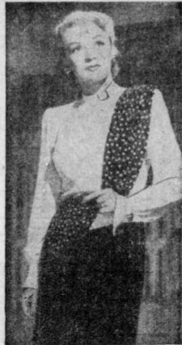
Eve Arden, une artiste de l'écran, porte souvent avec une jupe sombre une simple blouse chemisier, mais pour en atténuer l'excessive simplicité, y joint parfois une écharpe à pois ou autre à laquelle elle fait jouer le rôle de drapé.