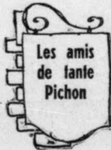
Les amis de tante Pichon

(Titre des Jeux de Cartes encyclopédiques de l'abbé Etienne Blanchard).