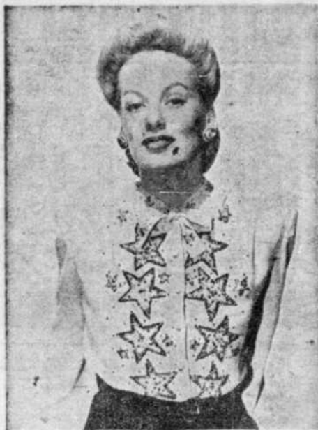
Pour les grands dîners et les réceptions habillées, la blouse somptueuse est toujours dans la note, portée sur une élégante jupe longue. Le modèle ci-dessus en crêpe blanc et agrémentée de broderie de sequins est sa suprême chic.

Blouses et gilets jouent tant le jour que le soir, un rôle de premier plan