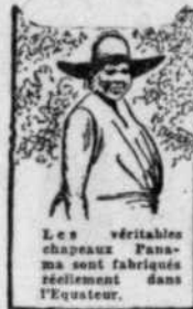
Les véritables chapeaux Panama sont fabriqués réellement dans l'Équateur.