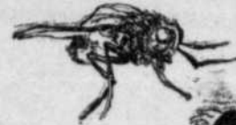
Une mouche domestique mange son poids de nourriture en moins d'une demi-minute.