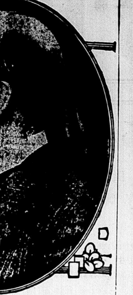
CHARLES E. HUGHES, candidat battu à la présidence des Etats-Unis, en 1916, et qui sera probablement le prochain secrétaire d'Etat.