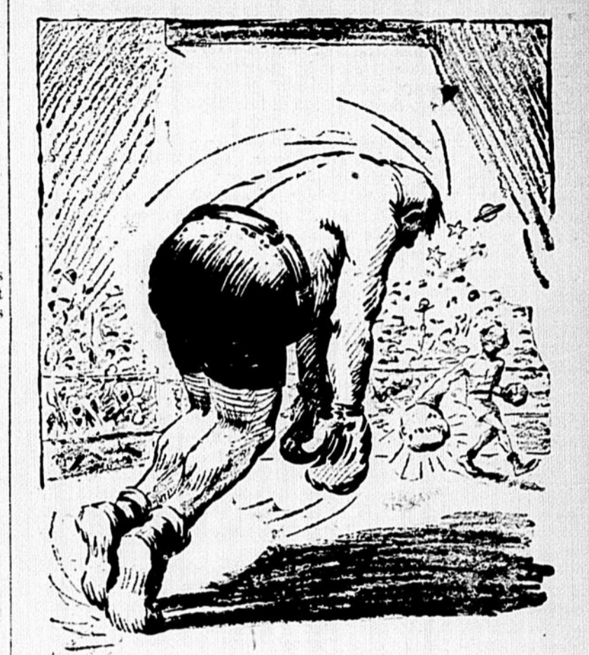
Le coût de la vie au consommateur. — Mon vieux, tu peux te vanter de m'avoir donné ça, avec ta grève!...