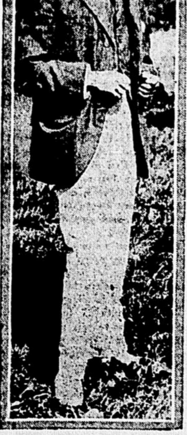
CONTRE LE TRAVAIL. Le prince Pignatelli d'Aragon, qui, après avoir épousé Miss Ruth Waters, riche héritière new-yorkaise, a refusé un emploi de son beau-père.

Quand j'aurais appris d'une nation quel genre de vie ils mènent, je croirais que les Français peuvent vivre sans gloire.