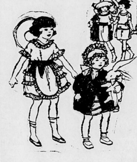
Vêtements pour Fillettes—Deuxième.

Tous les appareils électriques sont garantis pour douze mois sans défauts. Articles de Cuisine—Au Sous-sol