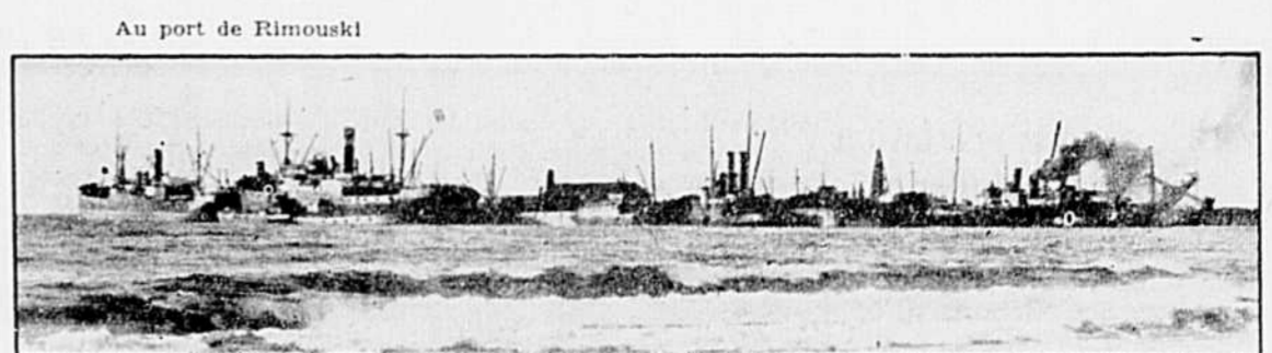
Au port de Rimouski