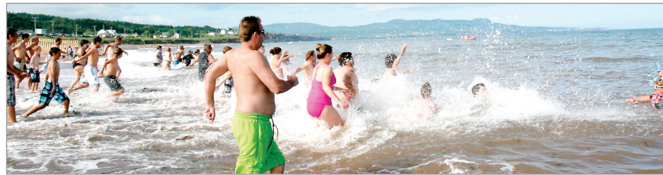
La population de la région a bien répondu ces dernières années à l'invitation de faire la « saucette » dans les eaux froides.

Vous avez envie de sauter à l'eau avec notre bande de fous? Manifestez-vous en solo ou par l'entremise de votre chef d'équipe. Il n'y a pas de restriction quant à l'âge; suffit d'un consentement parental. Contactez-nous en privé via la page Facebook Saucette au profit d'Opération Enfant Soleil ou par courriel sauceteos@gmail.com. La période d'inscription sera en vigueur jusqu'à ce que les 200 postes de sauceteurs soient pourvus! Premiers arrivés, premiers inscrits!