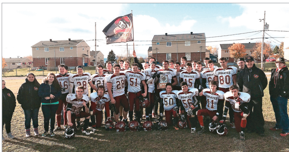
La valeureuse équipe des Pirates a remporté un très beau match.

Une belle prestation avec des jeux d'un haut calibre. La coupe du président se veut l'emblème de football par excellence dans notre région, est une source importante de motivation et de persévérance scolaire pour les garçons. Félicitations aux deux équipes et à l'an prochain!