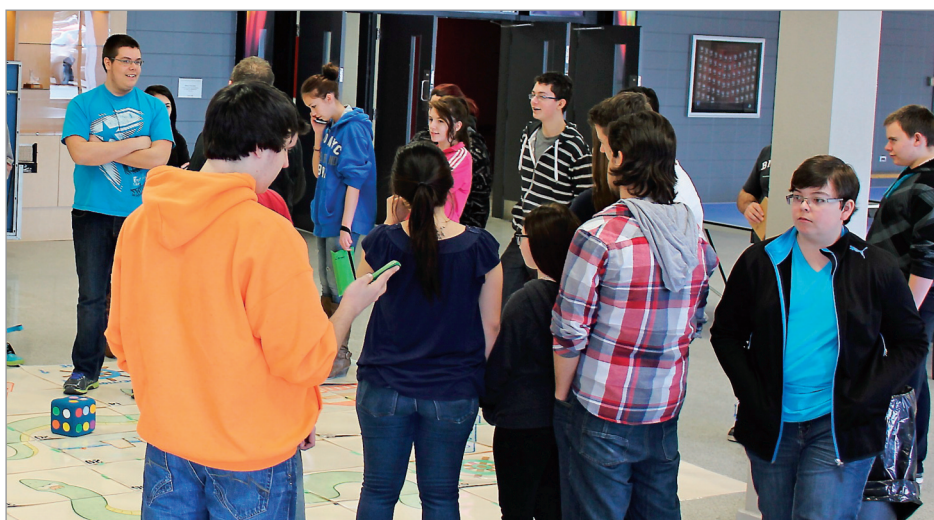
Encore une fois, les jeunes de la région feront les frais des coupures du gouvernement.