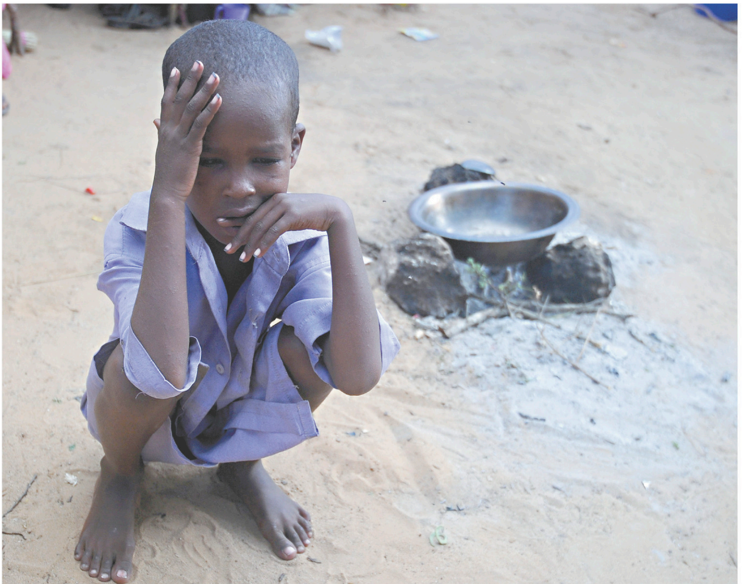
Un enfant somalien attendait dans un camp de réfugiés improvisé, en mai 2017, en banlieue de Mogadiscio, après que sa famille eut dû quitter sa région en raison d'une forte sécheresse.

C'est le nombre de personnes qui ont pris part aux manifestations à travers la France jeudi, selon le ministère de l'Intérieur. Elles étaient 149 000 samedi dernier et 452 000 le 9 janvier, de même source.