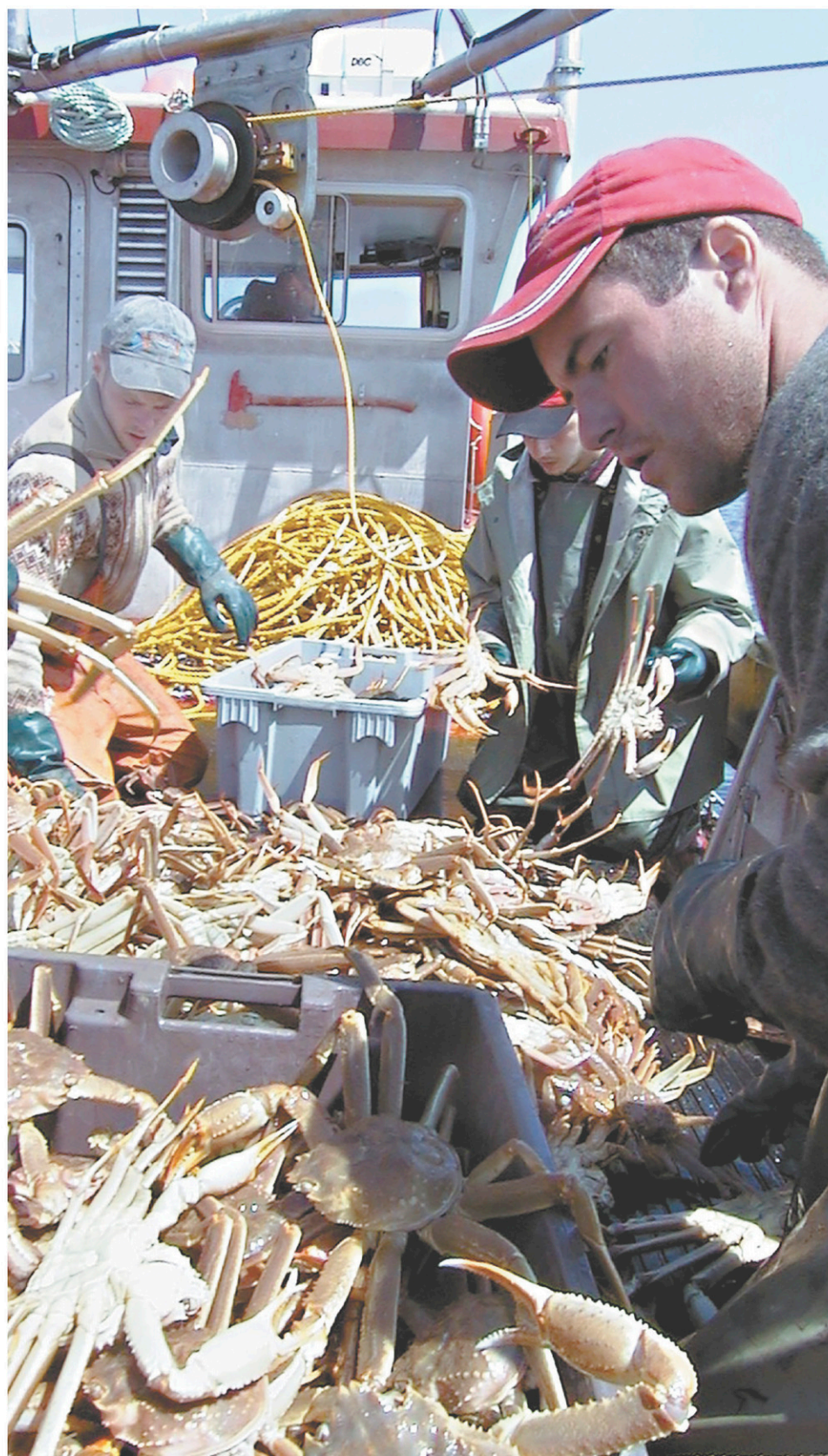
Pas moins de 90 % des exportations de crabe des neiges se font vers les États-Unis.

Les deux sénateurs et les deux membres du Congrès ajoutent que ces mortalités, qui menacent la survie de l'espèce, font craindre aux pêcheurs de homard américains la mise en place de mesures encore plus contraignantes dans les eaux côtières du Maine.