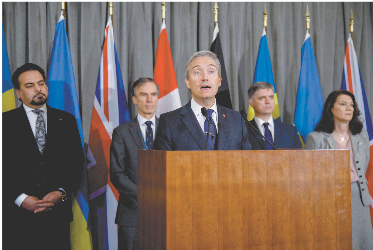
Le ministre canadien des Affaires étrangères, François-Philippe Champagne, en compagnie de ses homologues des pays dont des ressortissants sont décédés dans l'écrasement d'un avion civil abattu par les forces armées iraniennes : Idrees Zaman (Afghanistan), Andrew Murrison (Royaume-Uni), Vadym Prystaiko (Ukraine) et Ann Linde (Suède).

En supprimant ce cours, le Québec a une occasion unique de consolider l'étude des sources religieuses de notre civilisation en confiant ces connaissances, non plus à des missionnaires de l'« ouverture », mais à de véritables professeurs d'histoire, de français ou d'histoire de l'art