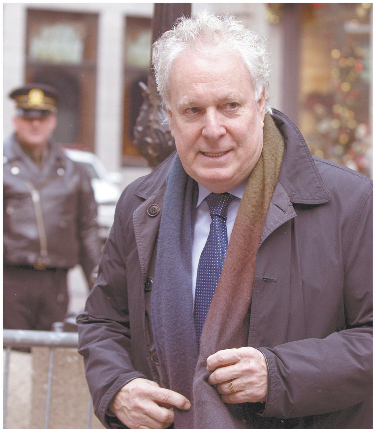
L'enquête Mâchurer colle à la peau de l'ancien premier ministre Jean Charest, lui qui songe à un retour en politique active et qui pourrait donc entrer dans la course à la direction du Parti conservateur du Canada.