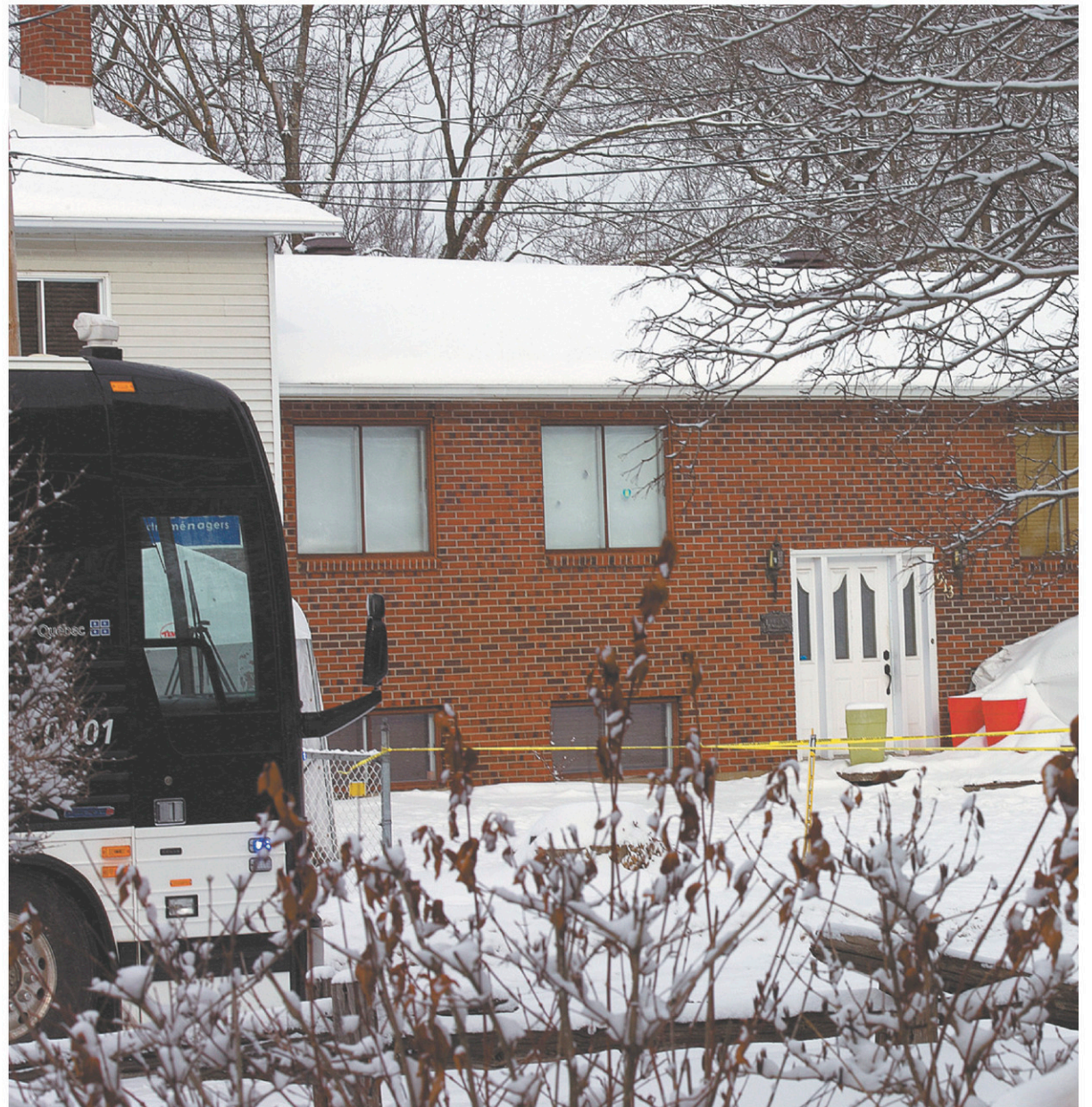
Jaël Cantin aurait été assassinée en pleine nuit à son domicile du chemin des Anglais, à Mascouche.

La thèse de la violence conjugale, tout comme celle d'une invasion à do-