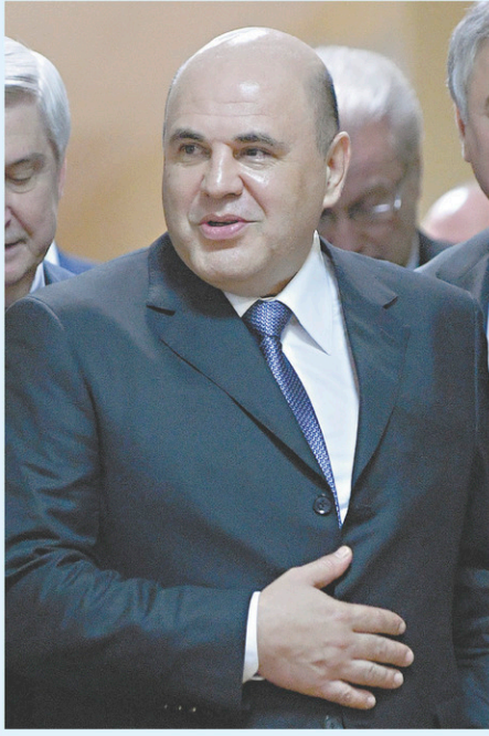
Mikhaïl Michoustine