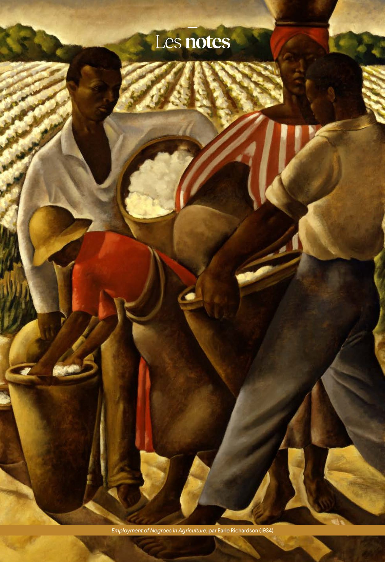
Employment of Negroes in Agriculture, par Earle Richardson (1934)