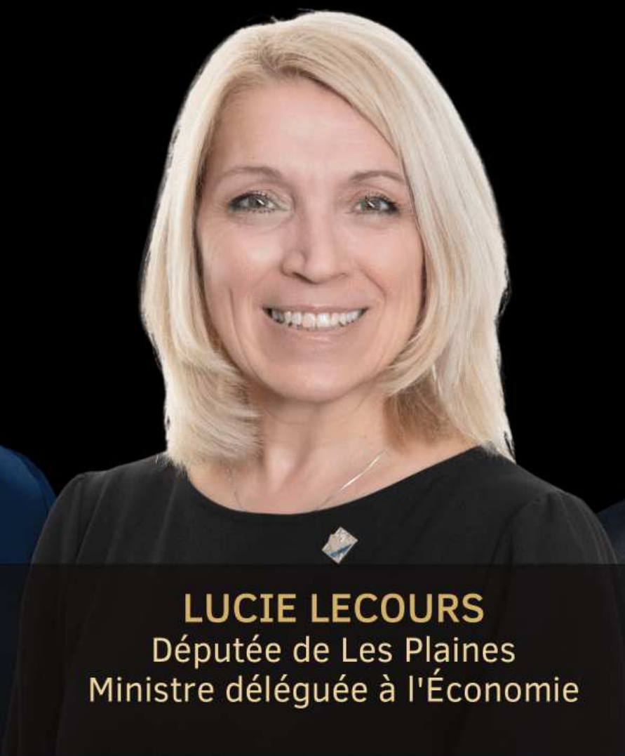
LUCIE LECOURS Députée de Les Plaines Ministre déléguée à l'Économie