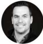
Germain Havey Flexia Conseil