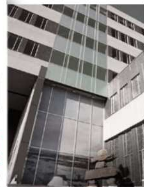
Siège social, 2022