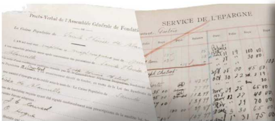
1922 - Procès-verbal de l'Assemblée de fondation de la Caisse Populaire de Sainte-Thérèse de Blainville.