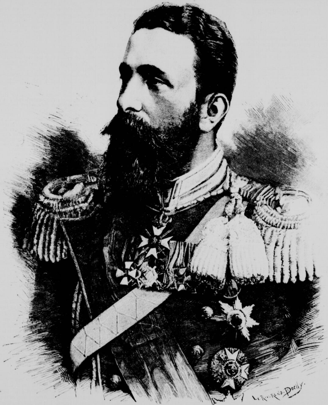
LE PRINCE ALEXANDRE DE BULGARIE

ABONNEMENTS : Six mois : $1.50. — Un an : $3.00