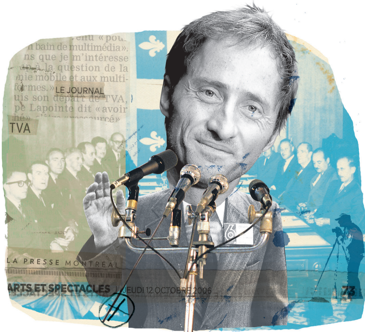
ILLUSTRATION FRANCIS LÉVEILLÉE, LA PRESSE ©