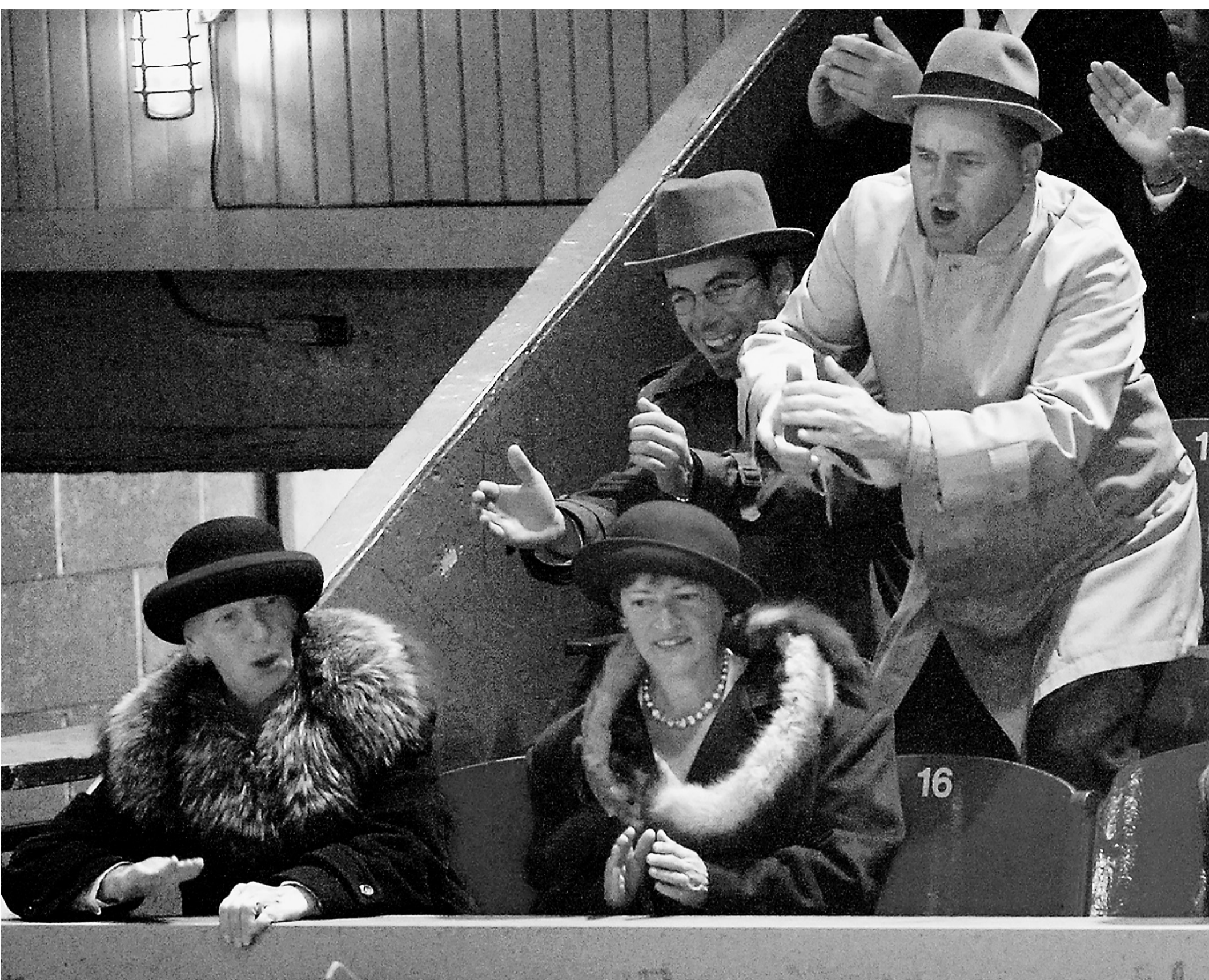
Des figurants en tenue d'époque jouent leur rôle pendant le tournage du film Maurice Richard , au Colisée de Québec.