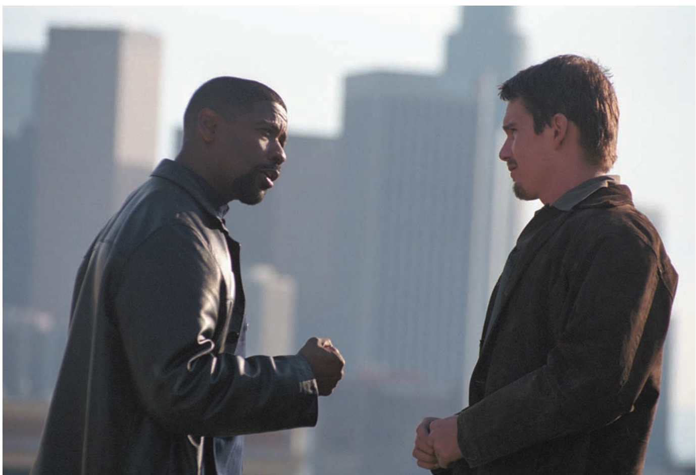
Denzel Washington et Ethan Hawke dans une scène du film Training Day dont la sortie a été retardée de deux semaines en raison de la tragédie du 11 septembre.