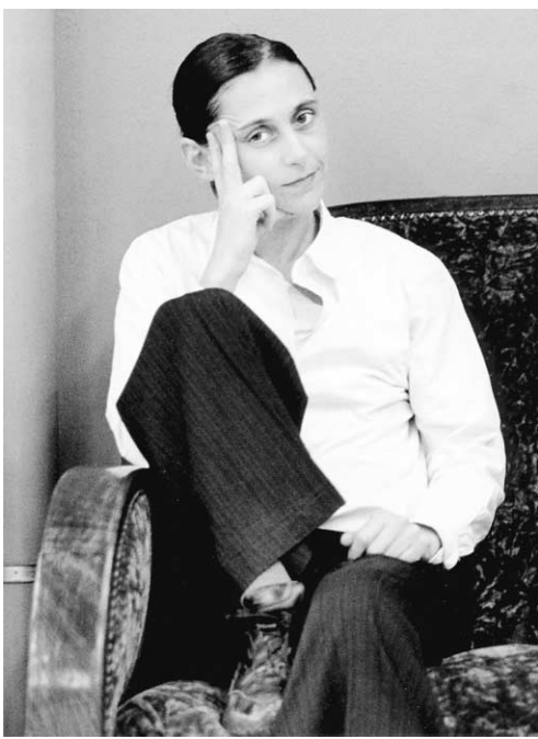
La fondatrice de la compagnie Rosas, Anne Teresa de Keersmaeker.

On insiste beaucoup à son sujet sur l'intransigence de la formation, celle de ses interprètes reflétant sans doute la