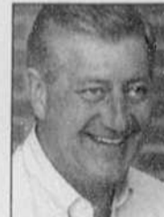
Mike Harris, premier ministre élu.

Bien que fragmentaires, ces résultats donnent la mesure de la volatilité de l'électorat ontarien au terme d'une campagne à deux vitesses, née