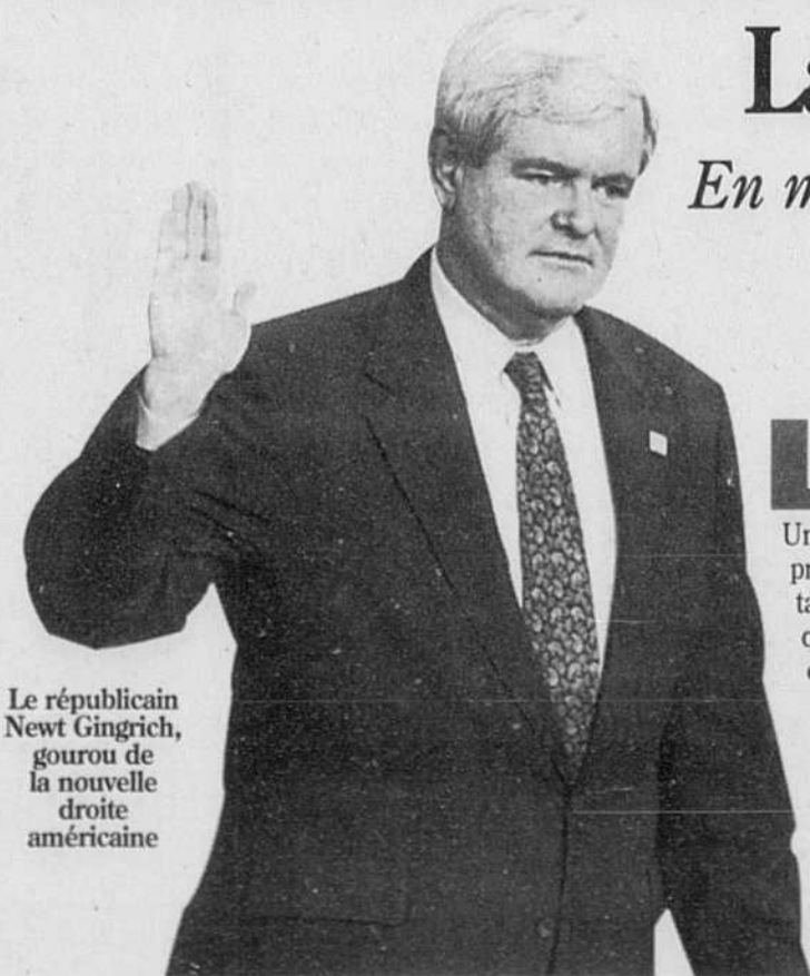
Le républicain Newt Gingrich, gourou de la nouvelle droite américaine