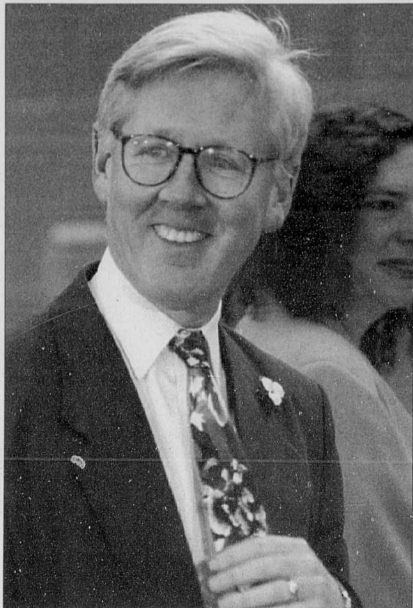
Le néo-démocrate Bob Rae: la porte de sortie.

Jusqu'à la toute fin, tout le monde pouvait quand même nourrir quelque espoir en raison des distorsions du vote que crée une lutte à trois. Aux élections générales de 1990, les néo-démocrates avaient d'ailleurs été les premiers surpris à prendre le pouvoir de façon majoritaire avec seulement 38 % des voix. Ils avaient récolté 74 sièges, contre 36 aux libéraux et 20 aux conservateurs.