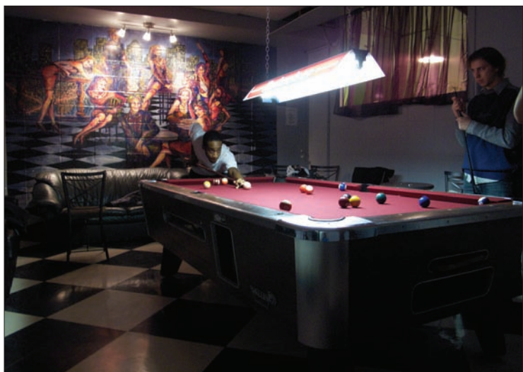
La table de billard au local I-005