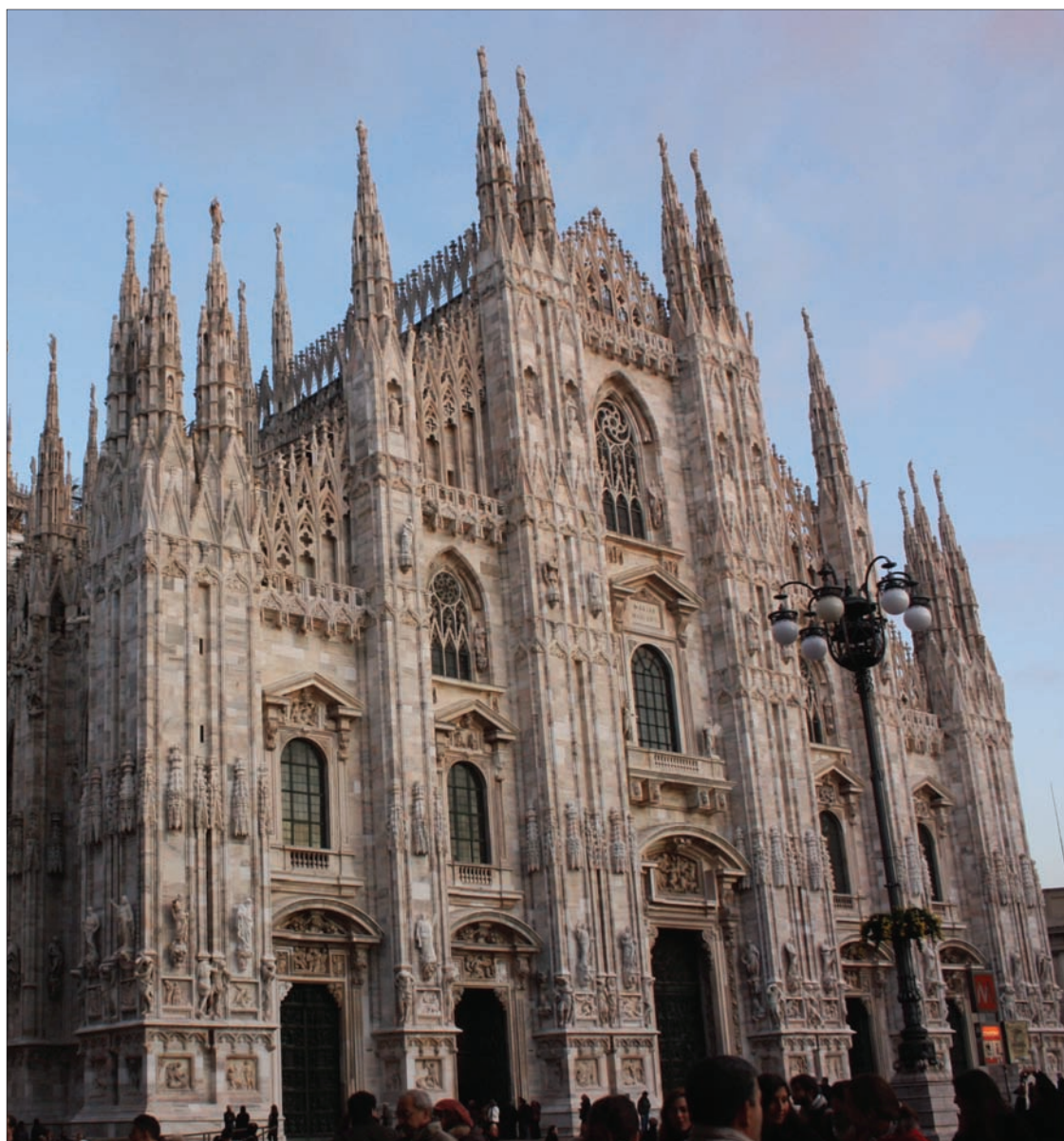
Milan tel que vue à travers la caméra de notre reporter international.