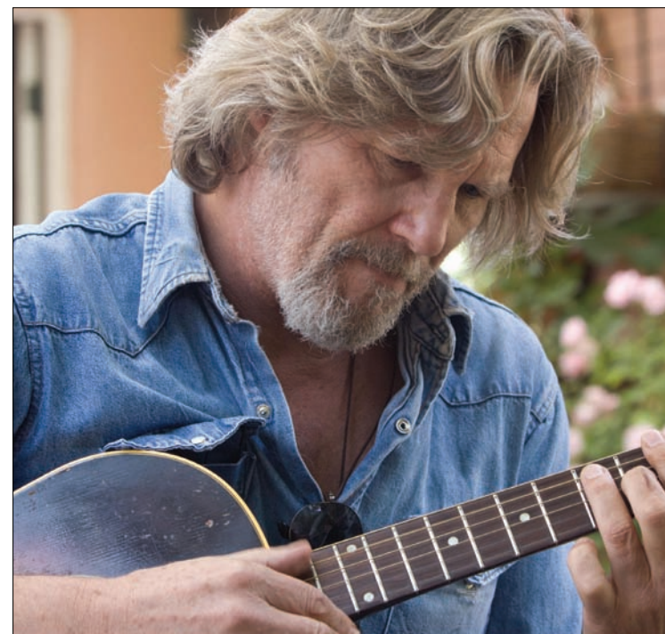
Jeff Bridges dans le film Crazy Heart.

Goldens Globes et on ne peut que lui souhaiter de continuer sur la même lancée. C'est donc un film à aller voir non pas pour l'histoire en elle-même car elle n'apporte pas grand-chose mais plus pour la qualité musicale de l'œuvre. Et si vous êtes en plus fan de country alors ce film est pour vous. Crazy Heart , un film pour une soirée tranquille.