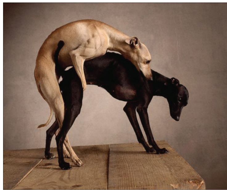
Le chien, exemple suprême de la fidélité !

rare, mais quand on y goûte, on se sent plus léger dans notre intellect, la vie paraît plus juste, on se sent intègre et l'intégrité, ça se sent. Les autres gens intègres se joindront à vos côtés et vous ne serez plus en situation de conflits moraux et de dilemmes. Les choix seront de plus en plus simples, évidents et faciles à faire puisque vous vous connaîtrez et vous serez fidèle à vous-même. Bref, quand on fait des efforts dans la vie, c'est payant. Quand même étonnant qu'être fidèle puisse être profitable, aussi égoïste que vous soyez !