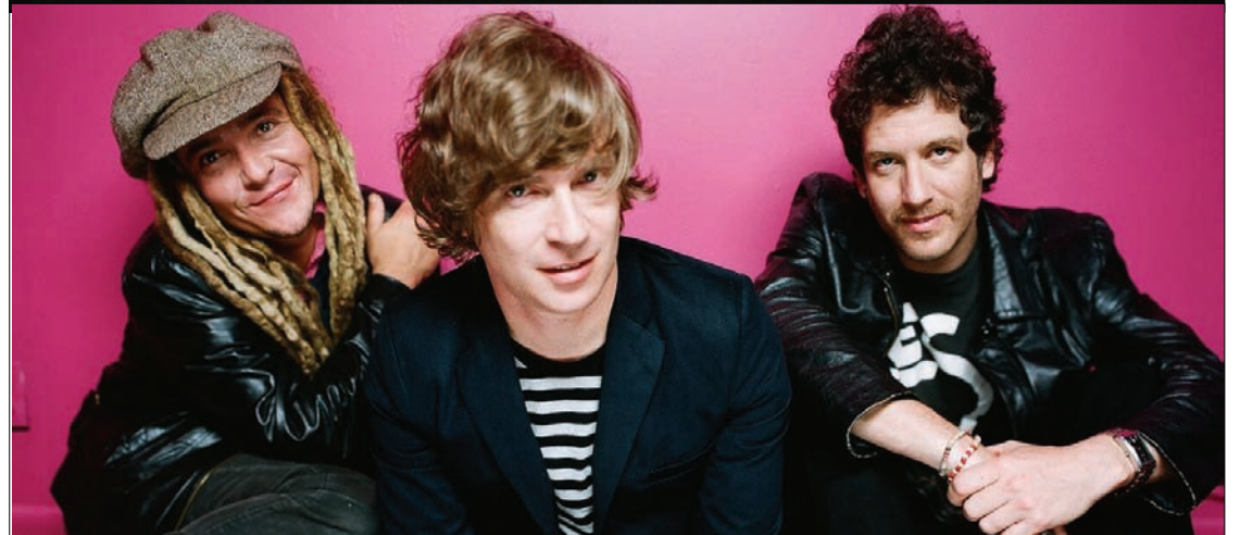
De haut en bas : PSY , prochain spectacle des 7 Doigts de la Main. Vue de l'installation de l'exposition Entracte : films d'un futur héroïque présentée au CCA. Nada Surf , pour la promotion de leur album.