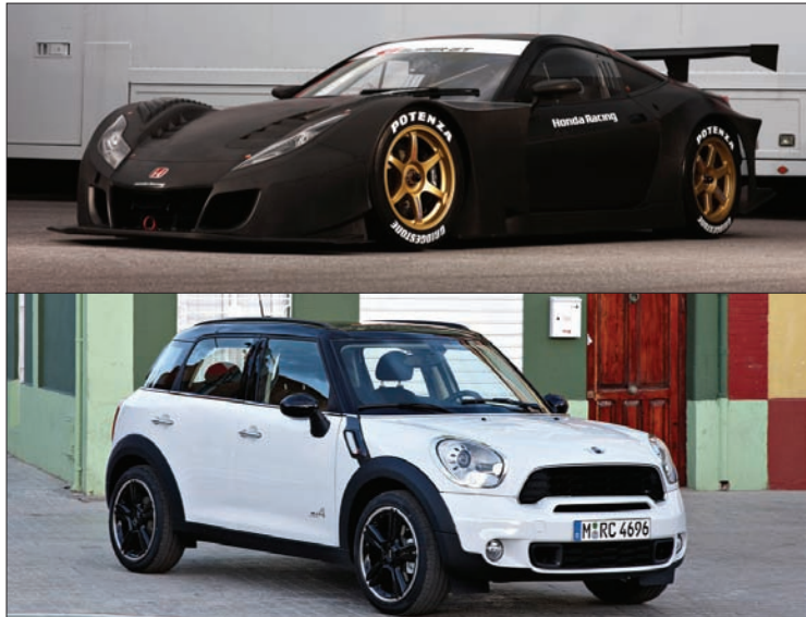
De haut en bas : La très racée Honda HSV-010 L'épouventail Mini Countryman

de grand tourisme basée au Japon : la HSV-010. Présentement, il s'agit d'une voiture destinée uniquement à la course, mais rien n'empêche les amateurs de rêver à une version de route qui remplacerait la défunte NSX. De plus, la très féline carrosserie est motivée par un V8 3,4 litres fournissant 496 chevaux aux roues arrières. Sachant qu'il n'a que 1 102 kilos à mouvoir, les accélérations doivent déplacer beaucoup d'air. De plus, la sonorité du moteur vaut amplement un détour sur Youtube : la tonalité haut-perchée du V8 ressemble un peu à celle des Formule 1 actuelle, quoique ce n'est pas aussi splendide que la symphonie du V10 de la Lexus LF-A.