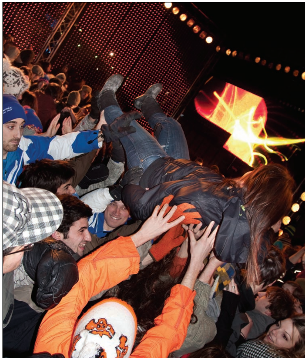
Le mode de locomotion préféré à l'Igloofest.

L'Igloofest, de 18h à minuit, sur le Quai Jacques Cartier du Vieux-Port de Montréal. Billets disponibles chez Moog Audio , Atom Heart , Off the Hook ou sur Ticket Pro , pour éviter la file de la billetterie.