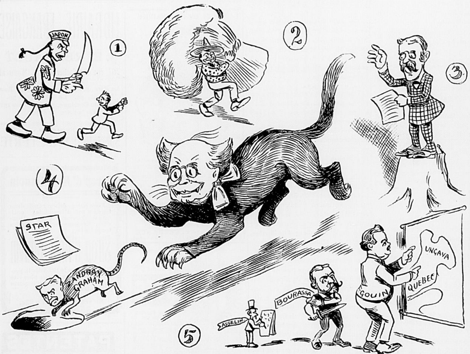
No 1. La peur jaune. — No 2. Qui donc ose crier famine? — No 3. Borden parle dans le désert. — No 4. La chasse aux masques. — No. 5. La découverte de l'Ungava — Bourassa est en train de se tailler un territoire!