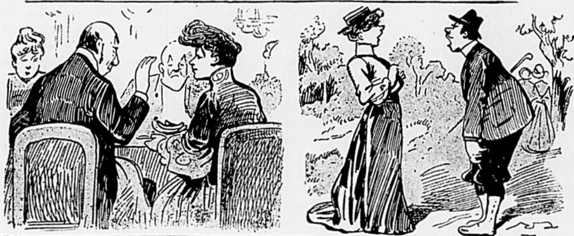
- Vous ne prenez pas de melon? - Jamais... du moins quand je dine en ville... Il me produit un effet instantané.