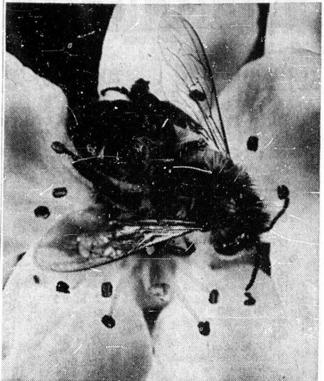
"A Place for Everything" — Au programme d'histoire naturelle du poste de télévision de langue anglaise, CBOT (canal 4), les "mouvements indicatifs" de l'abeille, apparentés à une "danse rituelle"; on croit que ces mouvements de l'abeille ouvrière servent à indiquer à ses compagnes, la direction et la distance des fleurs riches en pollen et en miel.