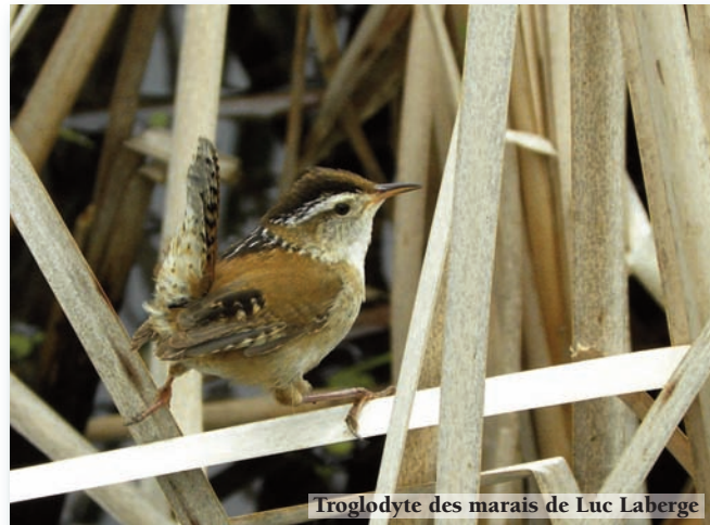
Troglodyte des marais de Luc Laberge