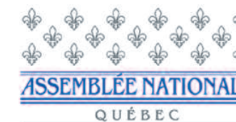
Mathieu Traversy Député de Terrebonne