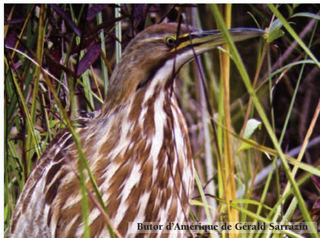
Butor d'Amérique de Gérald Sarrazin