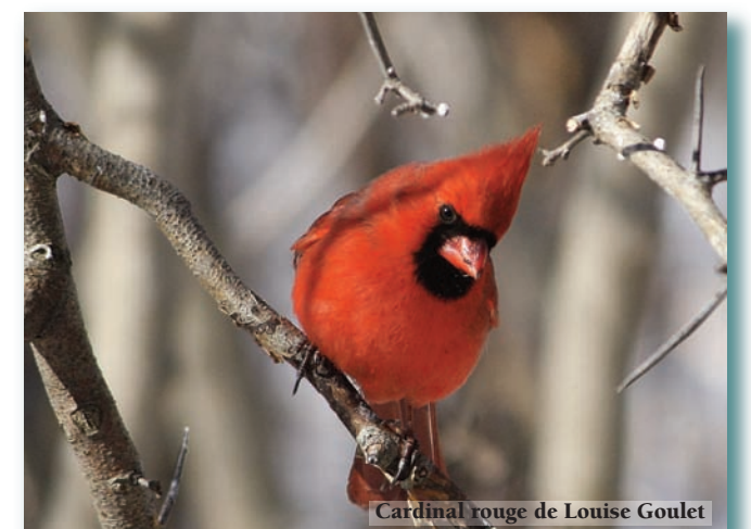
Cardinal rouge de Louise Goulet