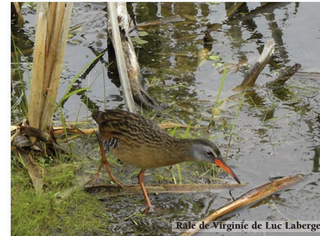
Râle de Virginie de Luc Laberge