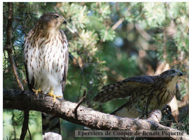
Eperviers de Cooper de Benoît Piquette