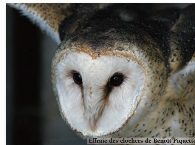
Effraie des clochers de Benoît Piquette