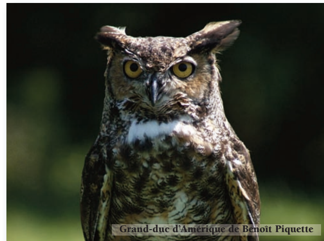
Grand-duc d'Amérique de Benoît Piquette