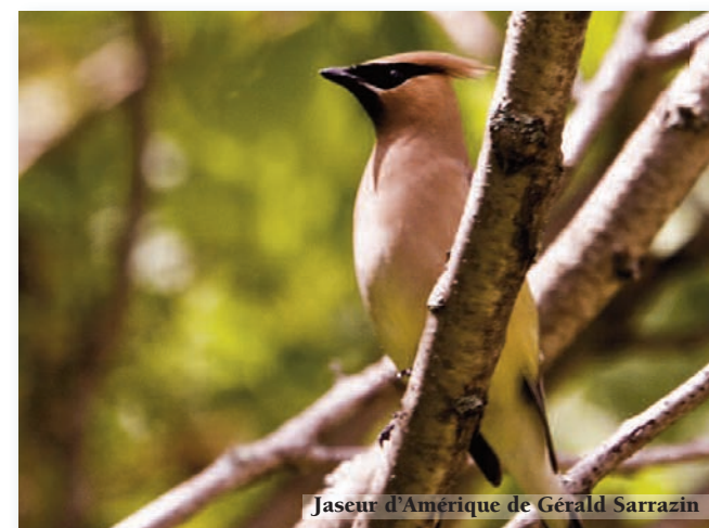
Jaseur d'Amérique de Gérald Sarrazin