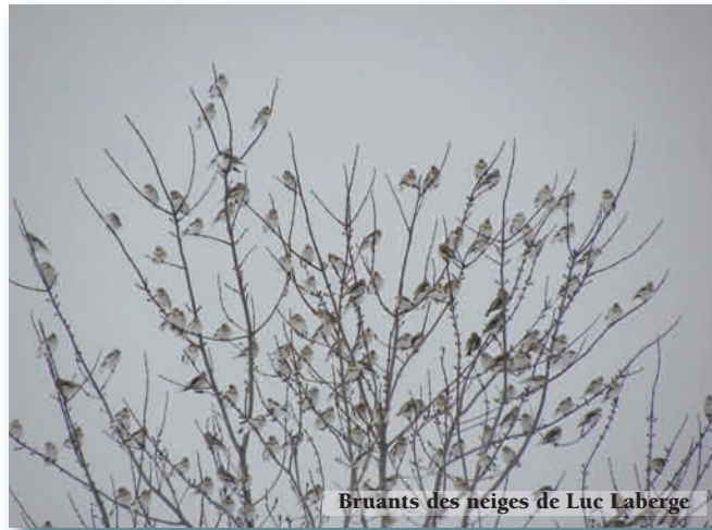
Bruants des neiges de Luc Laberge