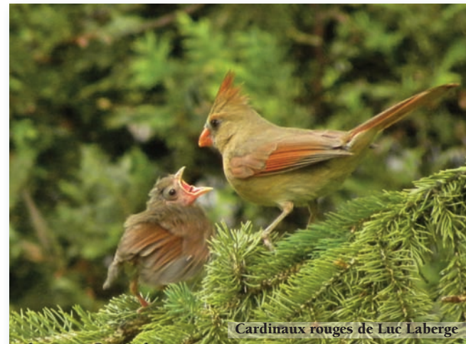
Cardinaux rouges de Luc Laberge