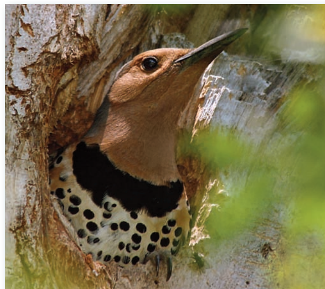
Pic flamboyant de Rachel Jacklyn Bilodeau http://pbase.com/rachelita • http://rachelita.oiseaux.net