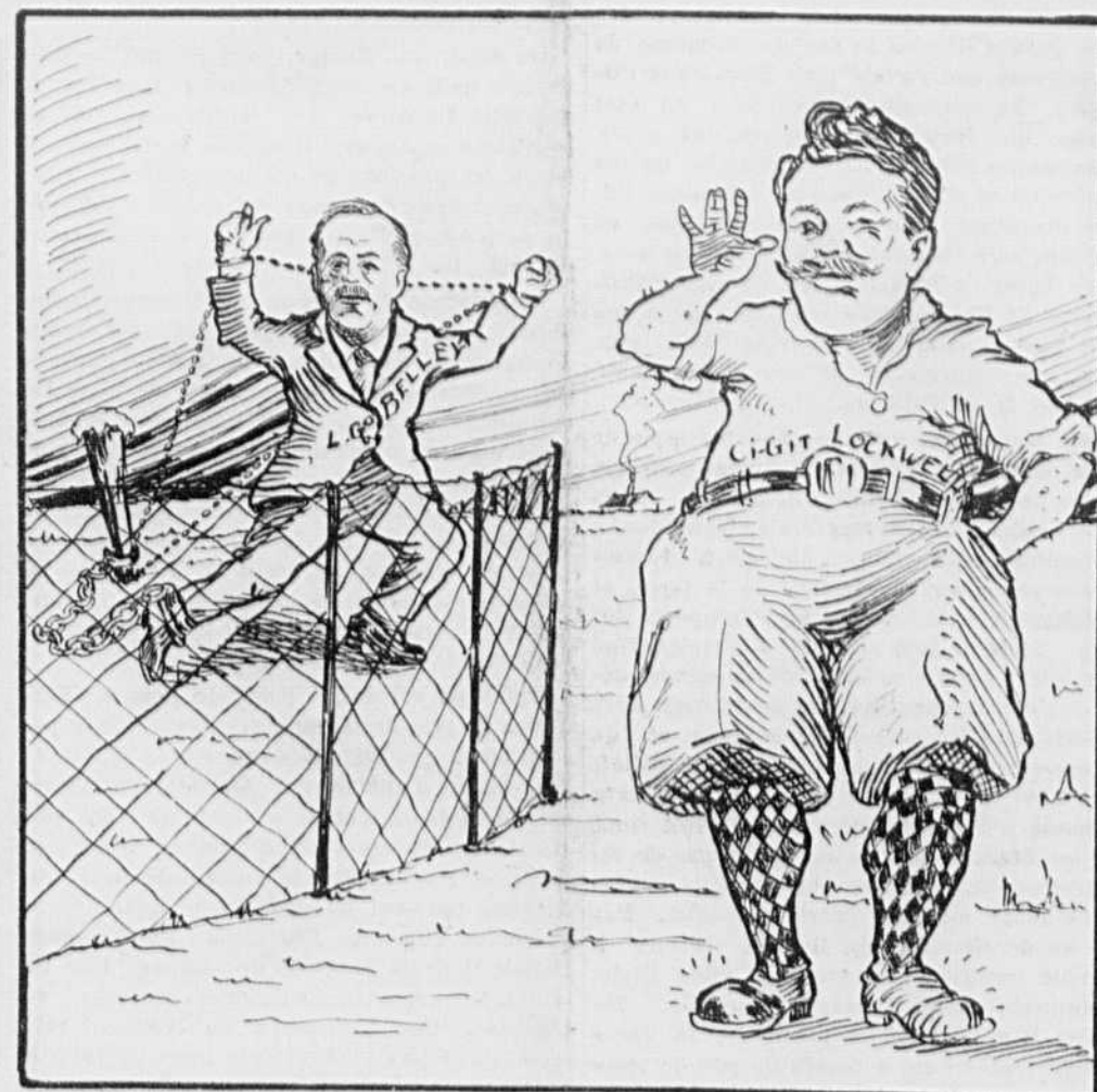
Ne voulant pas lâcher L.-G. Belly dans la campagne, Ci-Git Lockwell met au vert l'ancien collègue de M. Monty.

Je débute ce cinquième article avec une certaine amertume. Ayant aperçu, au cours de cette étude où j'ai mis tout le sérieux de mon esprit et toute la sincérité de mon cœur, la voie véritable vers laquelle il est nécessaire d'orienter les destinées canadiennes, c'est avec un élan profond que j'entends des voix de chez nous, des compatriotes, prêcher une doctrine de dépression et de ruine. De tous ces hustings où résonne le cri protectionniste part aujourd'hui une semence de désastre et de désespoir. On voudrait ligoter la liberté du commerce, fermer sans retour le marché des États-Unis, réduire notre industrie à la seule clientèle canadienne, qui est insuffisante, élever le coût de la vie sur toute la ligne, rançonner le peuple au moyen de l'impôt douanier pour favoriser quelques entreprises, livrer ce jeune pays à une espèce d'association de vampires dont le rôle est d'écumer les deniers populaires et de verser une obole au trésor électoral de politiciens sans conscience, sans principes, et sans foi publique. Et dire que ce sont des personnes prétendues honnêtes, des aspirants aux plus hautes fonctions, qui donnent dans cette turpitude démagogique, dans ces théories perverses qui, si on les appliquait, retarderaient de cent ans notre progrès économique. Dieu merci, le peuple ne boira pas ces hérésies formidables. Le bon sens éloignera de sa lèvre le calice où des pervers, des ignorants ou des imbéciles ont versé le poison et la misère.