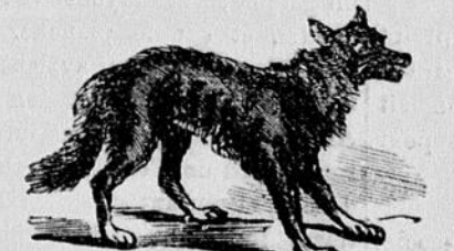
A L'ENSEIGNE DU LOUP.

Vendue Par Tous Les Droguistes Et Commerçants De Medicines. A. VOGELER & CIE. Baltimore, Md., U. S. A. Québec, 19 octobre 1882.—6m