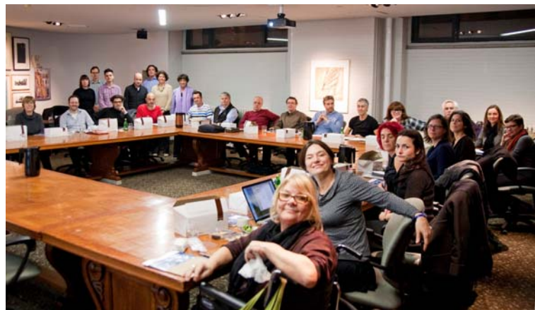
Cohorte 2012 de la Formation sur la gouvernance des organismes artistiques