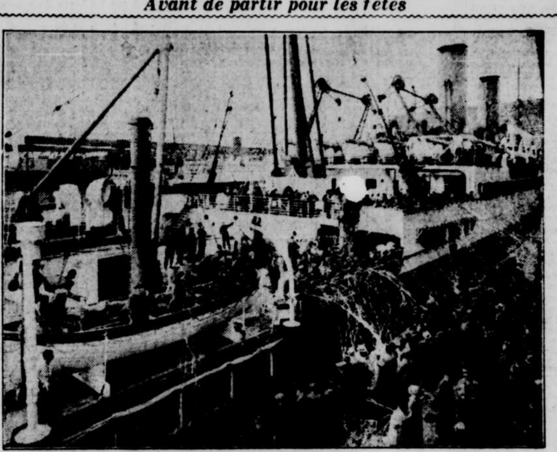
Avant de partir pour les fêtes

Il sera très ardu de transporter en France, comme on le prévoyait, des milliers de femmes et d'enfants parce que la grande cité basque est investie presque entièrement par les Nationaux qui vont tenter un suprême effort pour s'en emparer.