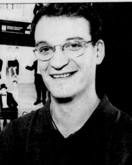
Pascal Clément pense également qu'il faut réduire la durée des matchs de volleyball.