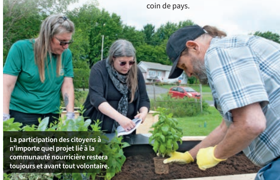
La participation des citoyens à n'importe quel projet lié à la communauté nourricière restera toujours et avant tout volontaire.

«Ça les intéresse lorsqu'ils mettent la main à la terre. Après ça, ils arrivent à la maison et ils vont en parler avec leurs parents. Je pense que c'est en impliquant les jeunes [au projet] qu'on va aller chercher [le reste de] la population», estime-t-elle.