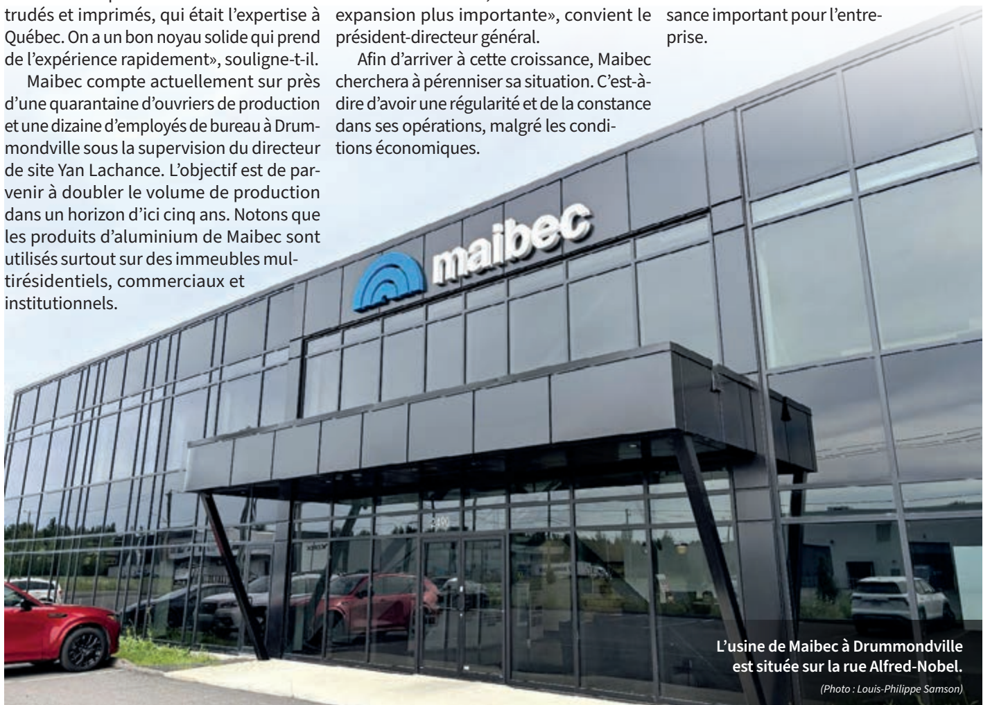
L'usine de Maibec à Drummondville est située sur la rue Alfred-Nobel.

Un lancement de cette gamme de produits a d'ailleurs eu lieu plus tôt cet été à Drummondville. Représentant moins de 10 % des activités de Maibec, les produits d'aluminium sont un vecteur de croissance important pour l'entreprise.