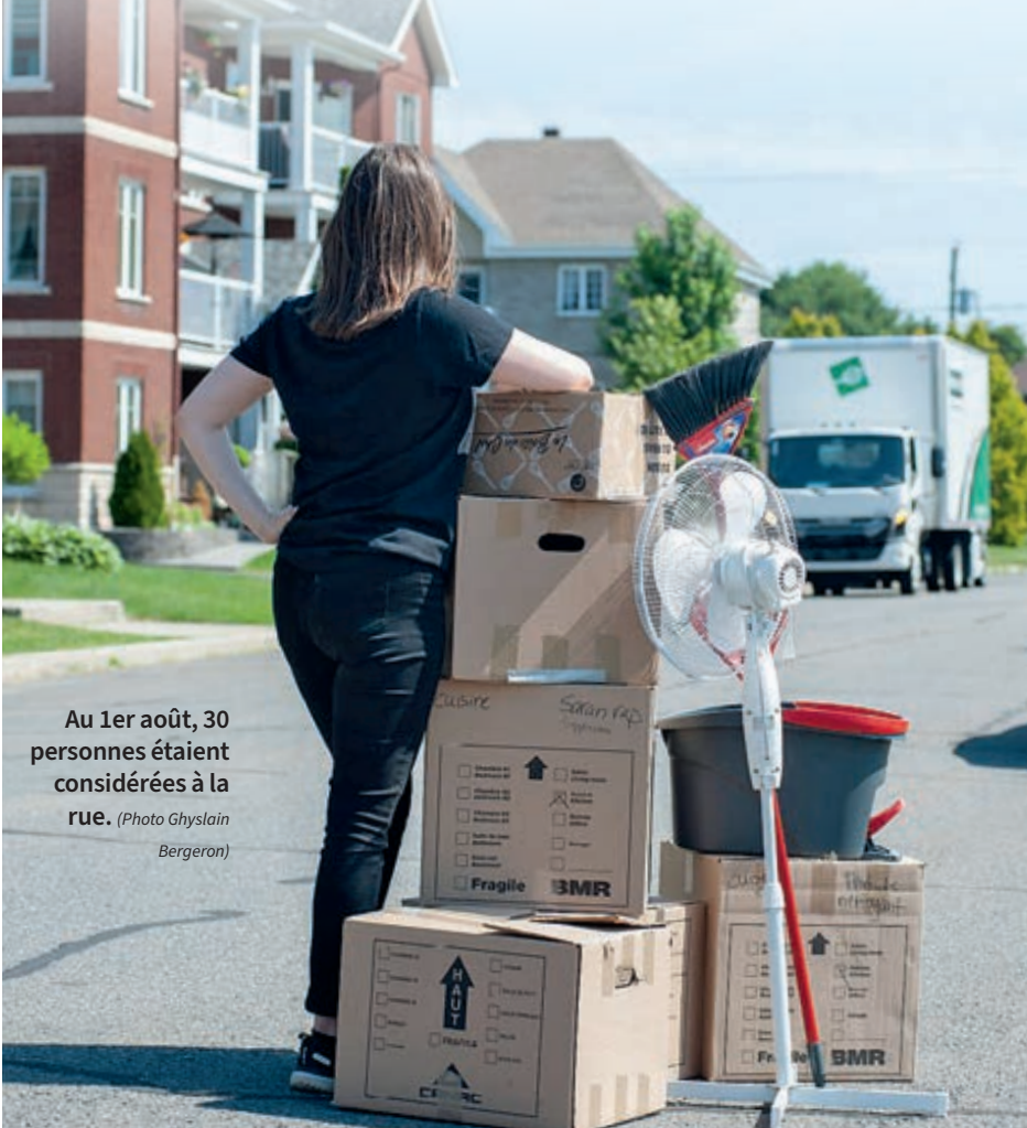
Au 1er août, 30 personnes étaient considérées à la rue.

L a situation demeure préoccupante en matière de recherche de logement. En un mois, le nombre de ménages sans solution d'hébergement à court terme est passé de 62 à 68.