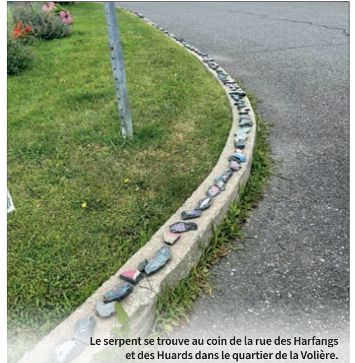
Le serpent se trouve au coin de la rue des Harfangs et des Huards dans le quartier de la Volière.

La famille à la base de l'œuvre au coin de la rue des Harfangs et des Huards espère un jour pouvoir regarder le serpent manger sa propre queue!