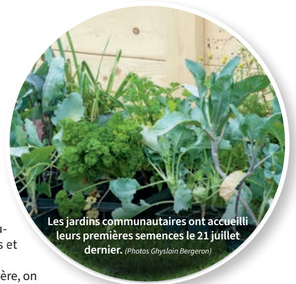
Les jardins communautaires ont accueilli leurs premières semences le 21 juillet dernier.

L'une des orientations principales inscrites dans le PDCN est d'encourager les