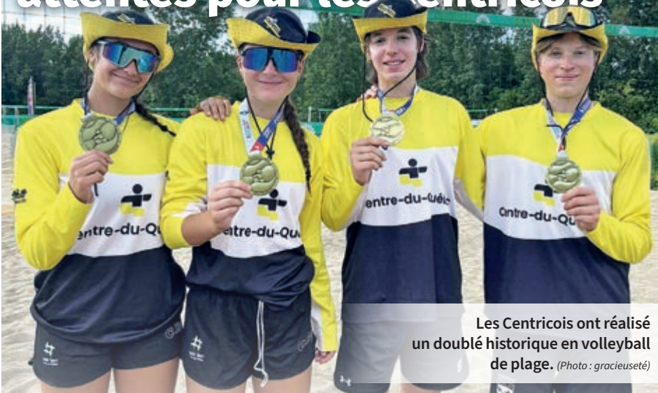
Les Centricois ont réalisé un doublé historique en volleyball de plage.

L' édition 2025 de la finale des Jeux du Québec est maintenant terminée et le Centre-du-Québec peut se vanter de s'être grandement amélioré. Entre augmentation de médailles, bannières d'esprit sportif et troisième place au classement de la région s'étant le plus améliorée, les athlètes Centricois peuvent être fiers de leurs performances.