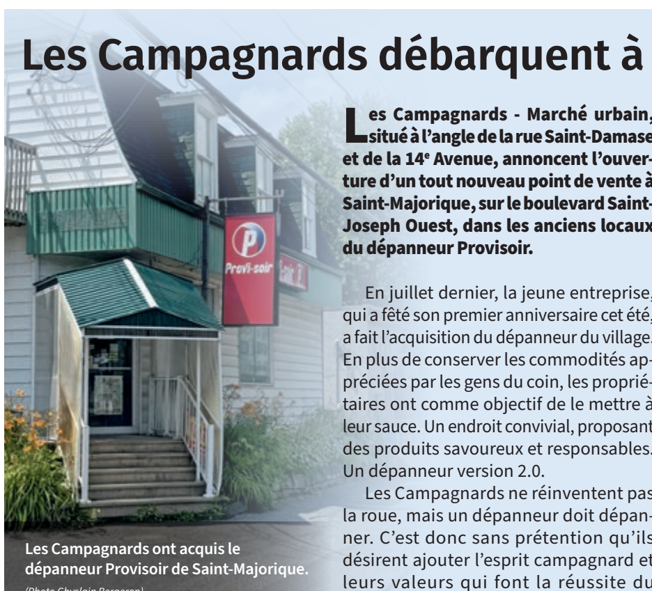
Les Campagnards ont acquis le dépanneur Proviso de Saint-Majorique.

Le commerce est fermé pour le moment, car des travaux de réaménagement sont nécessaires et la réouverture est prévue pour le 23 août. (GB)