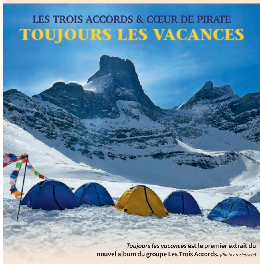
Toujours les vacances est le premier extrait du nouvel album du groupe Les Trois Accords.

A lors qu'ils sont encore dans leur tournée des festivals d'été, Les Trois Accords ont sorti une première chanson de leur prochain album à paraître cet automne.