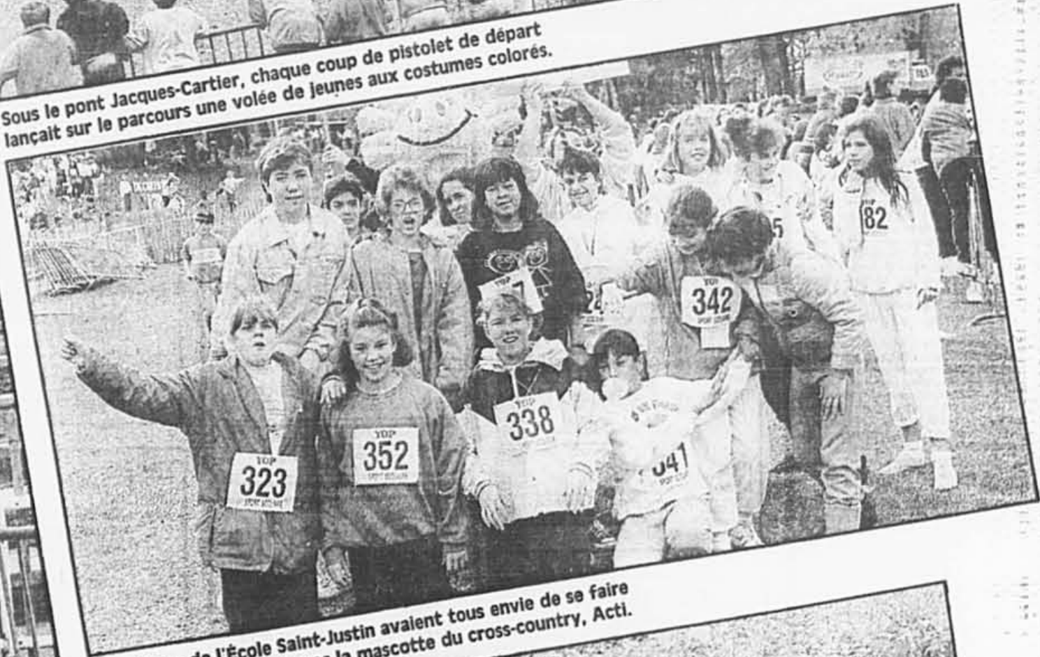
Les élèves de l'École Saint-Justin avaient tous envie de se faire photographier avec la mascotte du cross-country, Acti.