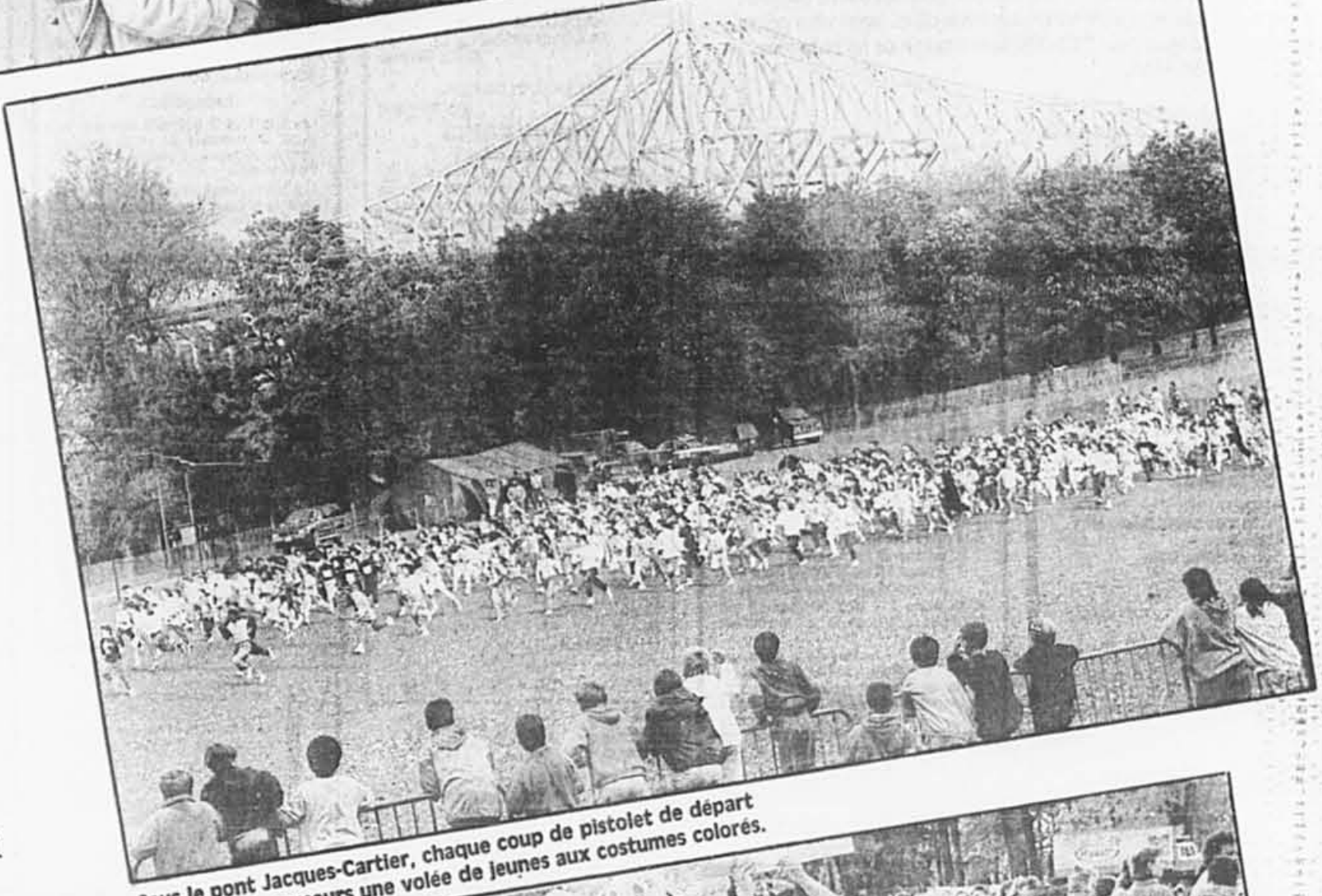
Sous le pont Jacques-Cartier, chaque coup de pistolet de départ lançait sur le parcours une volée de jeunes aux costumes colorés.

Plus de 200 bénévoles ont aidé à la réalisation de cet événement, et la STCUM avait prévu une surveillance plus étroite des quais et des rames à la station Berri-UQAM. Tout s'est déroulé dans l'ordre et la joie.