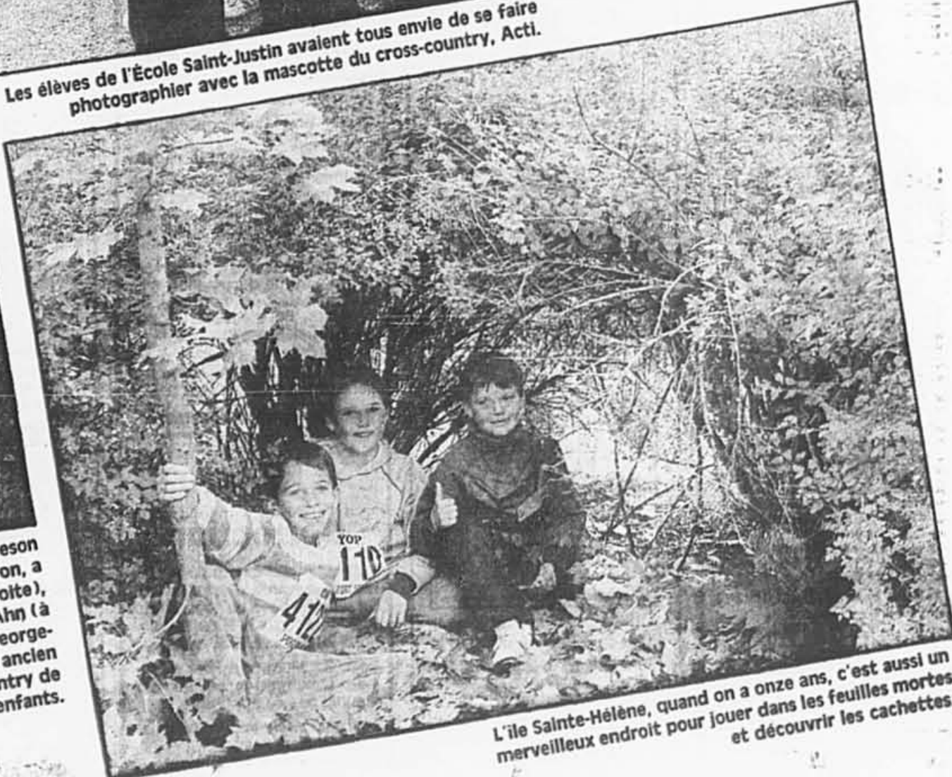
L'île Sainte-Hélène, quand on a onze ans, c'est aussi un merveilleux endroit pour jouer dans les feuilles mortes et découvrir les cachettes.