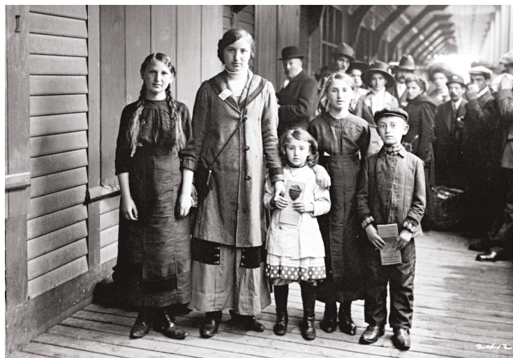
Des Juifs russes dans le port de Québec en 1910. La communauté juive est présente dans la ville dès le début du XIX e siècle.

Le lieu de l'événement — le théâtre Périscope — n'a pas été choisi par hasard. Avant de devenir une salle de spectacle, il abritait une synagogue construite en 1952. L'histoire du lieu à elle seule ne manque pas