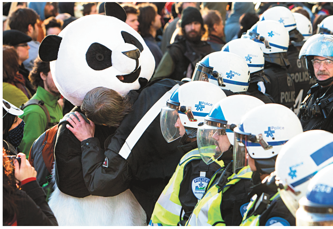
De nombreuses manifestations ont eu lieu ces derniers mois pour dénoncer le règlement P-6 comme ici, en avril dernier.

Alors la question à vous poser avant de venir manifester si vous ne désirez pas que votre liberté d'expression s'achète au prix des traite-