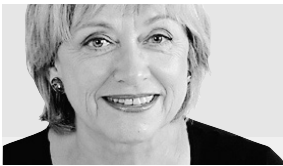
LYSIANE GAGNON lgagnon@lapresse.ca

Il y a quand même, parfois, de bonnes nouvelles. Prenez ce récent sondage CROP qui nous apprend que plus des Québécois ont des contacts avec des immigrants, plus ils sont portés à accepter des « accommodements » mineurs.