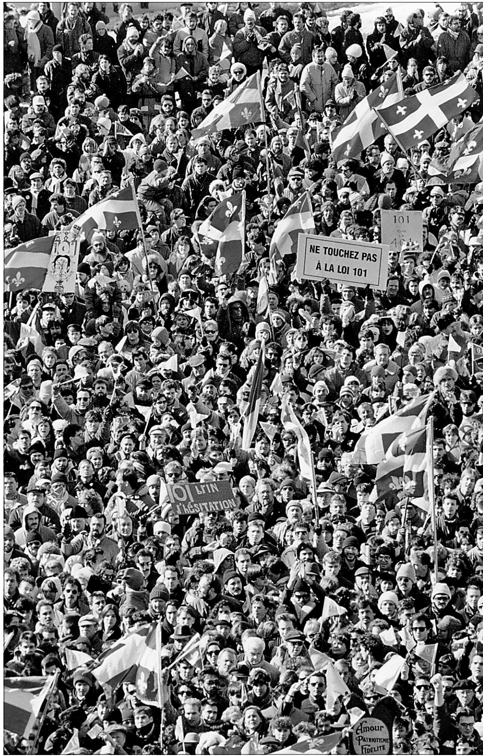
Le nationalisme n'a qu'un seul but, perdurer, et les problèmes dont il entretient lui-même l'existence constituent la justification de son règne.

Ainsi donc, le nationalisme québécois ne peut pas disparaître tant et aussi longtemps que la définition de la société québécoise ne changera pas. Tant et aussi longtemps que le Québec ne se définira pas autrement que par la poursuite de la tâche sacrée de maintenir vivante – ou apparemment vivante – une langue menacée (ou un de ses substituts: la foi ou l'indépendance), ce sera, sous quelque forme que ce soit, le